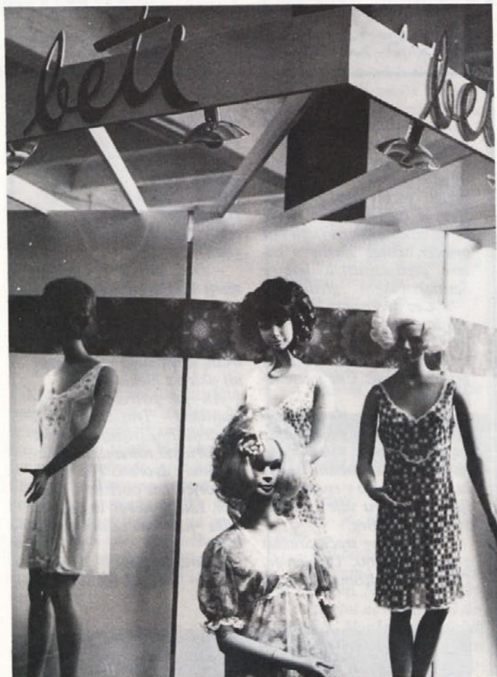
Na spomladanskem velesojmu v Zagrebu se je BETI dobro odrezala. Na fotografiji vidimo razstavnici paviljon tovarne.