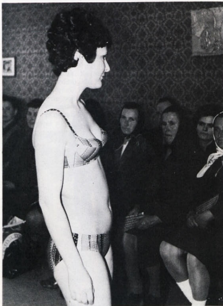
Za starše učencev poklicne šole so pripravili po končanem roditeljskem sestanku manjšo modno revijo, s katero so bili zelo zadovoljni. Nekateri so prvič videli tako prireditev.

Učenke poklicne šole BETI so sodelovale na nedavnem kvizu o znanju iz NOB. Tekmovanje je organizirala občinska konferenca ZMS Črnomelj v počastitev dneva OF, prireditev pa je bila 26. aprila zvečer. V ostri borbi so naše učenke zasedle prvo mesto. Čestitamo!