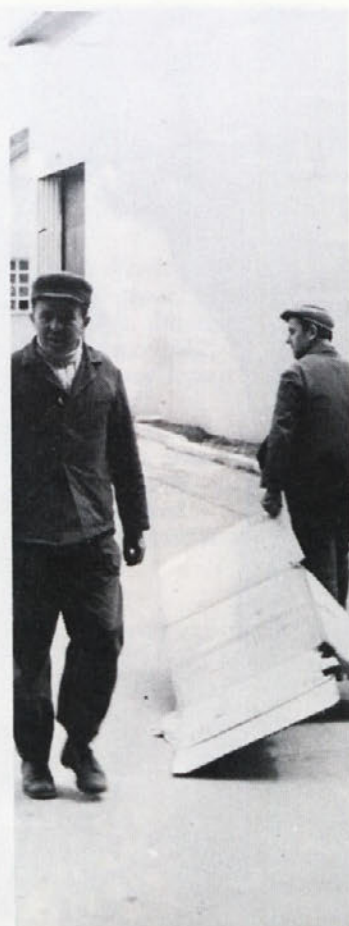
Metliški obrat je v zadnjem času pridobil novo skladišče na tovarniškem dvorišču. Ta gradnja je bila nujno potrebna