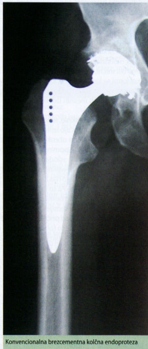
Konvencionalna brez cementna kolčna endoproteza