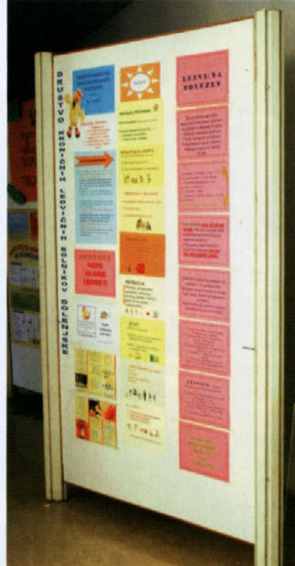
Informativni pano v bolnišnici Novo mesto, ki ga štirikrat na leto osvežimo z informacijami.

Od vsakega srečanja tako obiskovalci kot bolniki in zdravstveno osebje odnesemo zelo veliko. Obiskovalci pridobijo nova znanja in spoznanja, bolnikom občasno popestrimo ležanje na dializi, zdravstveno osebje pa dobi nove simpatizerje. Upamo si reči, da nekaterim mladostnikom na ta način pomagamo pri lažji odločitvi za nadaljnje šolanje. Bolj žalostno je