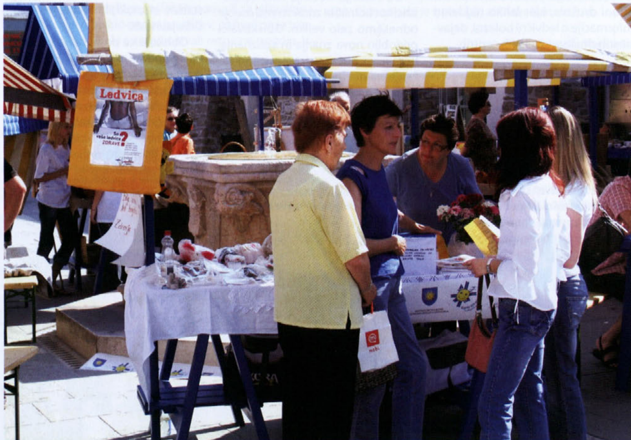
Pri naših dejavnostih pogrešamo predvsem več propagandnega materiala, zgibank, letakov, revije Ledvica, Ledvikov ...