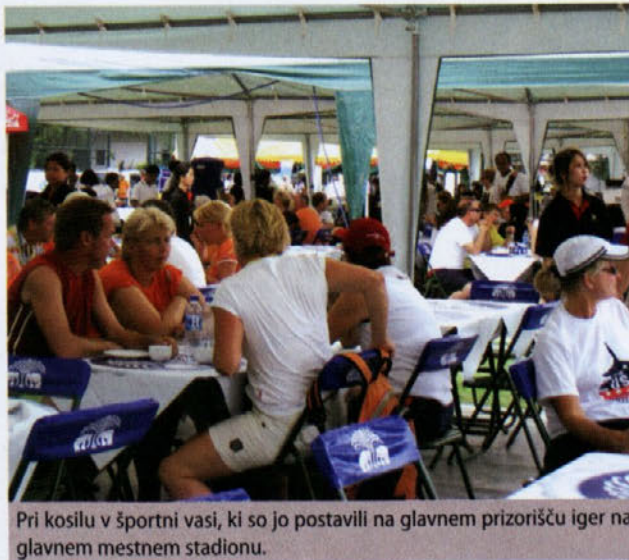
Pri kosilu v športni vasi, ki so jo postavili na glavnem prizorišču iger na glavnem mestnem stadionu.