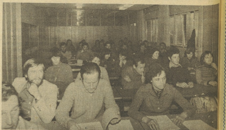
Med ustanovnim občnim zborom ŠD Avtoelektrike.

Prek 50 ljubiteljev raznih športnih panog in rekreacije Iskre Avtoelektrike (iz TOZD in DSSS lociranih v Novi Gorici), se je zbralo prejšnji četrtek v dvorani delavskega samoupravljanja z namenom, da ustanovijo športno društvo Iskra Avtoelektrika.