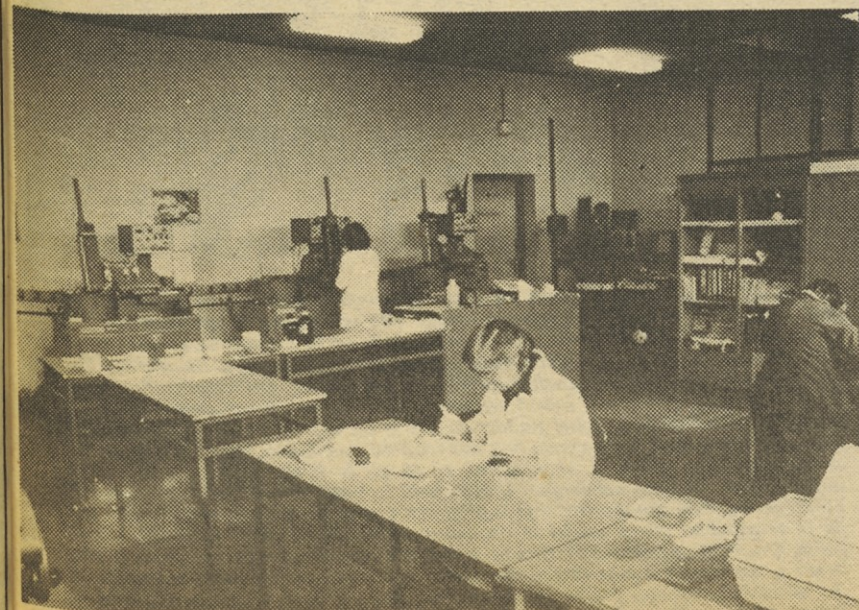
Obdelovalnica kristala v TOZD Polprevodniki.