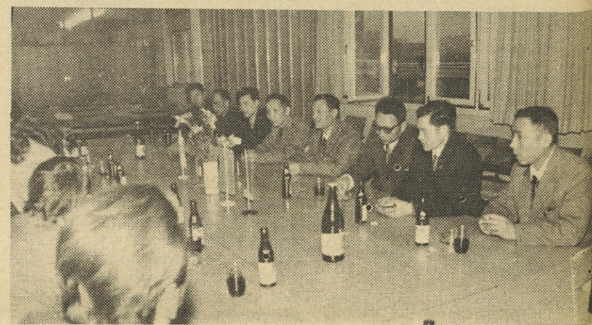
Med razgovori kitajskih gostov v Avtoelektriki.

V zvezi s tem obiskom sem postavil nekaj vprašanih pomočniku glavnega