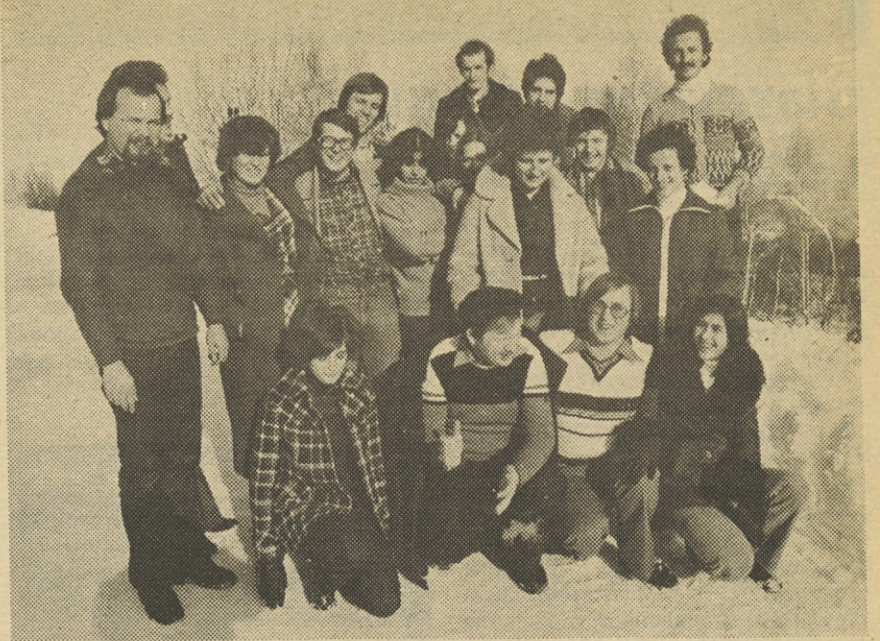
Na Kureščku so se v soboto, 13. januarja srečali mladinci IEZE na problemski konferenci. Razprava je tekla o akcijskem programu za letošnje leto in o tekoči problematiki osnovnih organizacij ZSMS in Koordinacijskega odbora ZSMS IEZE.

Razporeženje je bilo čudovito, saj se je v soncu in snegu vse iskalo. Mladinci iz različnih TOZD so srečanje izkoristili tudi za medsebojno spoznavanje in tako je konferenca v celoti dosegla svoj namen.