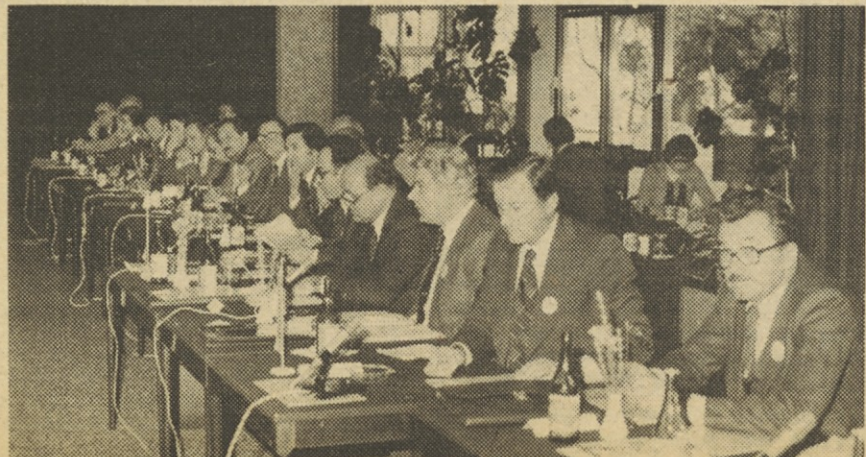
Posnetek z lanske zunanje-trgovinske konference.