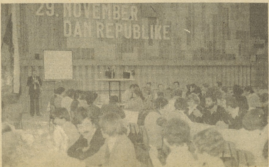
Lep obisk kulturnega srečanja delavcev TOZD TEA.