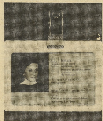
Vzorec osebne značke.