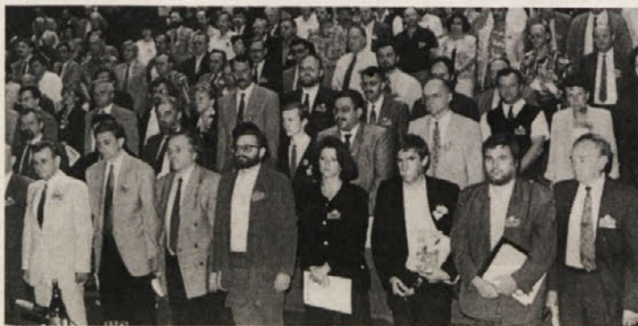
Začetek kongresa z državno himno