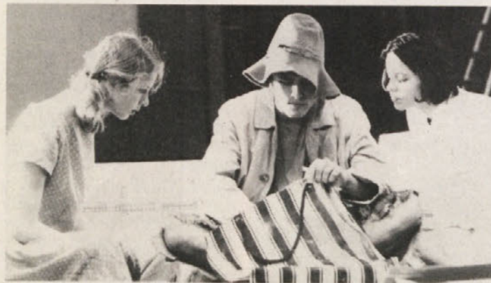
Prizor s predstave „Sonce nima hlačk...“

Tekst, napisan sodobnemu človeku, posebno mladini, na kožo, saj se mora – hočeš nočeš – ubadati s problemi, ki so jim jih nakopali na glavo odrasli.