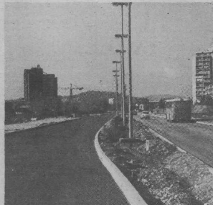
Posodobljena Šmartinska cesta