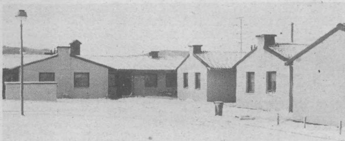
Iz barak v naselje Na rdečem blatu (KS Vevče — Zg. Kašelj)

V družbenih dejavnostih so bili izročeni svojemu namenu: vrtec za 60 otrok v Sneberjah, vrtec za 204 otrok v Štepanjskem naselju, kjer smo dodatnih 100 mest financirali iz sredstev družbenopolitične skupnosti in skupnosti otroškega varstva (15.637.965), prizidek k OŠ Leopolda Mačka-Boruta v Novem Polju, kjer je za dodatni program (štiri učilnice, mala telovadnica, večnamenski prostor, kuhinja in povečan program zunanje ureditve) občinska skupščina zagotavljala 24.184.288