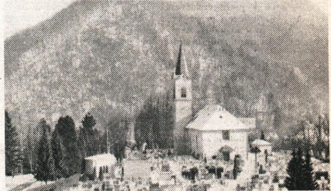
Pogled na Žale

Sogovornika sta nam povedala še, da bo žarni del pokopališča enotno urejen, za vse enako. Pri realizaciji žarnega pokopališča bodo upoštevali doseženo v dru-