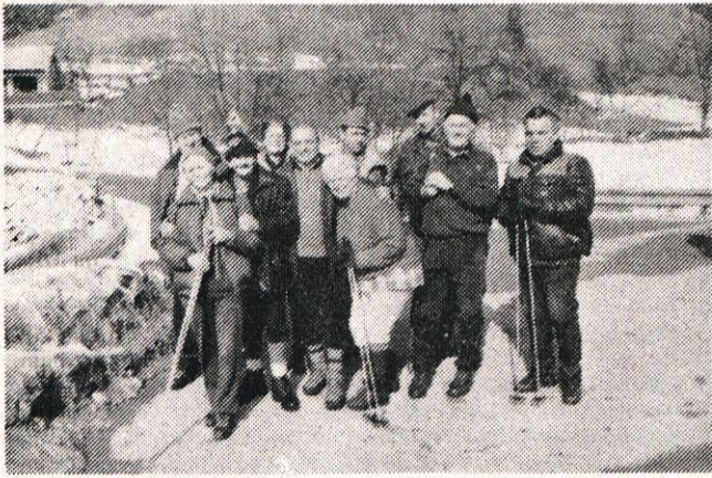
Skupina pohodnikov na Oseke

krajšo spominsko svečanost. Ob lepem sončnem zimskem nedeljskem dopoldnevu se je na prizorišču zbralo kar lepo število ljudi.