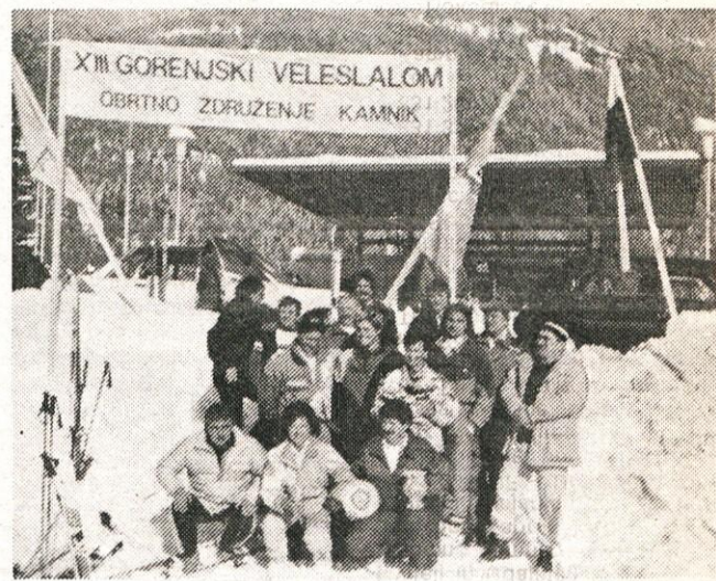
XII. veleslalom obrtnikov