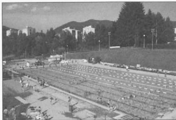
Že v prvih dneh poletja je bazen privabil številne kopalce.

Na igriščih, ki jih organizatorji želijo »oživiti in osvetliti«, je mogoče igrati odbojko na mivki, košarko, nogomet, namizni tenis, kegljati in se ukvarjati z atletiko. Lahko se vključite v brezplačne tečaje tenisa in badmintona. Avgusta