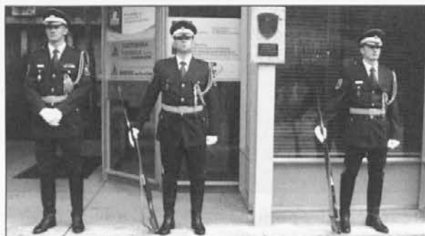
Protokolarna enota Slovenske vojske pred spominsko ploščo

»Manevrska struktura narodne zaščite (MSNZ) je nastala zaradi razoroževanja Teritorialne obrambe RS maja 1990, nato pa se je razvila v