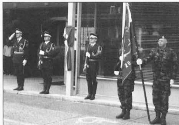
Slovesnost v znamenju zastav, praporov, svečanih uniform, orožja ...

oboroženo silo, ki je bila sposobna braniti proces osamosvajanja Slovenije. Sprva je šlo torej za ohranitev dveh poglavitnih virov, oborožitve in kadrov, zato sta bili prvi nalogi tajno skladiščenje orožja in skladno s količino ter z lokacijami prilagoditev kadrovske popolnitve enot TO ter načrtov njihove mobilizacije. Takoj po zagotovitvi omenjenih predpogojev smo pripravili načrt obrambe.