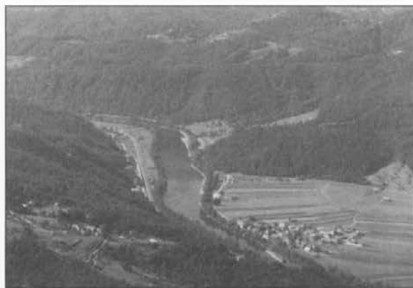
Razgled z vrha na dolino Save

Okolica Tončkovega doma na Lisci je še posebej zanimiva za tiste obiskovalce, ki prihajajo iz drugih delov Slovenije. Pokrajina je precej poraščena z bukvami in drugimi listnatimi drevesi. Med gozdovi se raztezajo prostrani travniki. Kmetije so redke in skromne. Veliko je