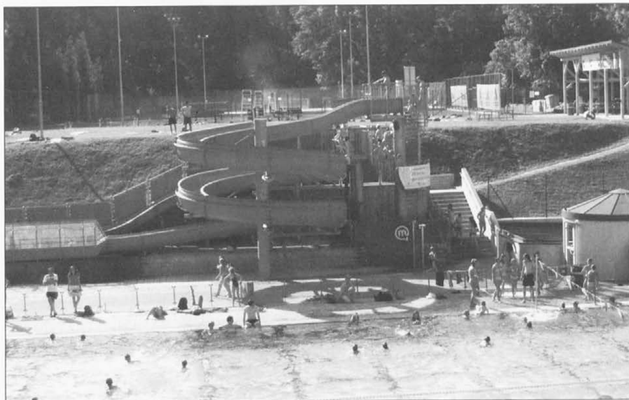
Tobogan je vseh zlasti mlajšim obiskovalcem mestnega kopališča.