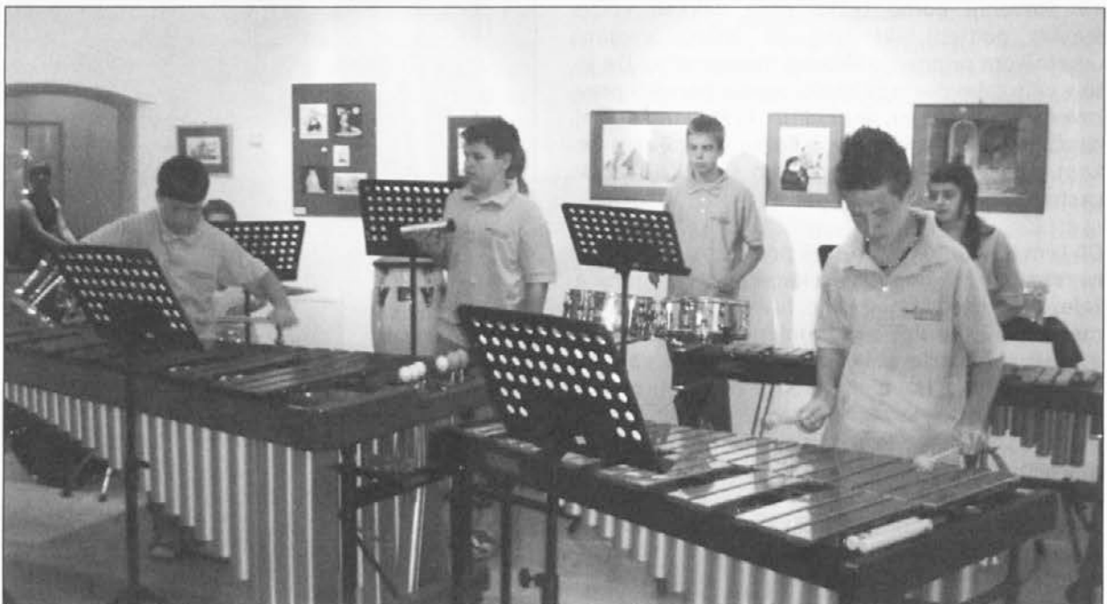
Ansambel tolkal Glasbene šole Ravne je popestril prireditvev.