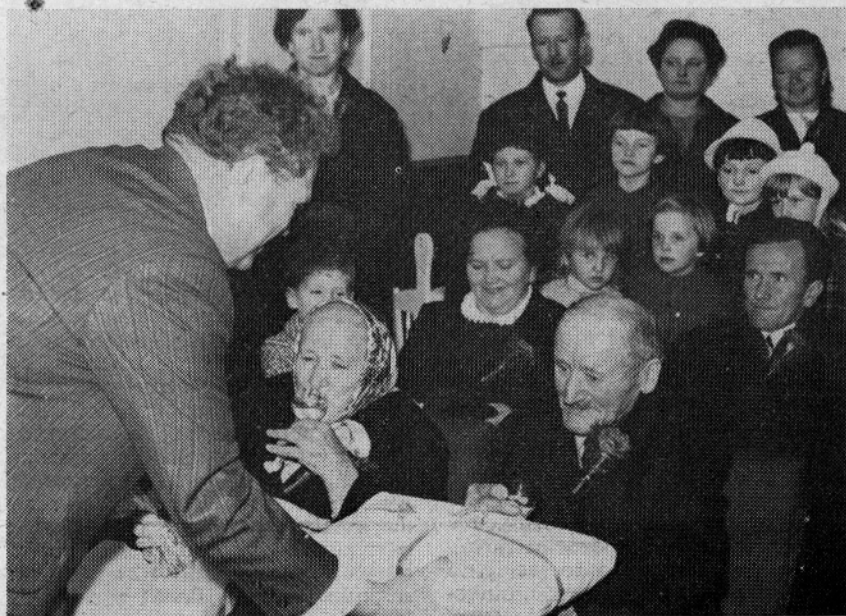
TRETJI PAR ZLATOPOROČENCEV PRI POROČNEM OBREDU POTEM, KO JIMA PREDSTAVNIK »VOLNE« IZROČA DARILU

Vsem jubilantom k redkemu življenjskemu prazniku iskreno čestita tudi uredništvo.