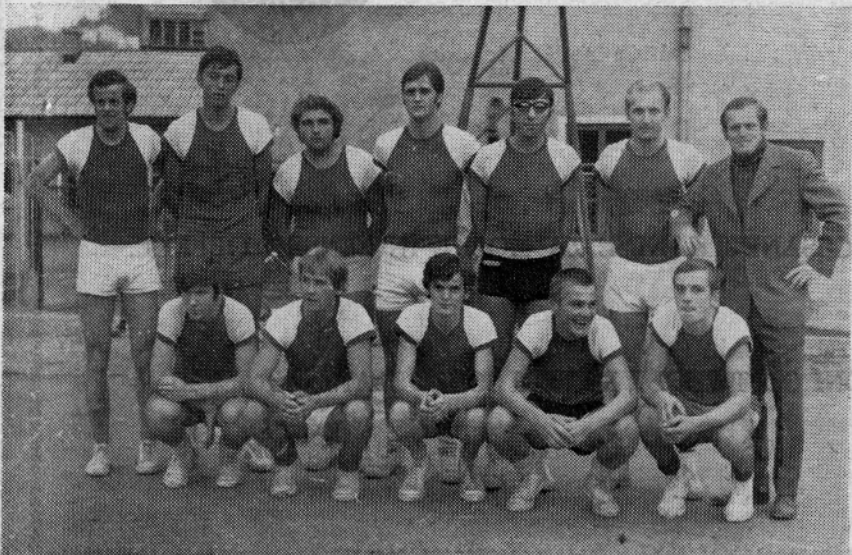
EKIPA KOŠARKARJEV IZ LASKEGA