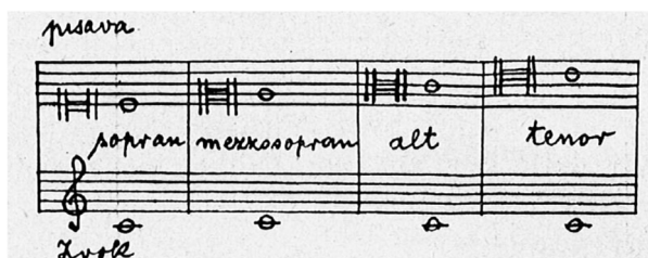
Slika 1: Razlaga c-ključev