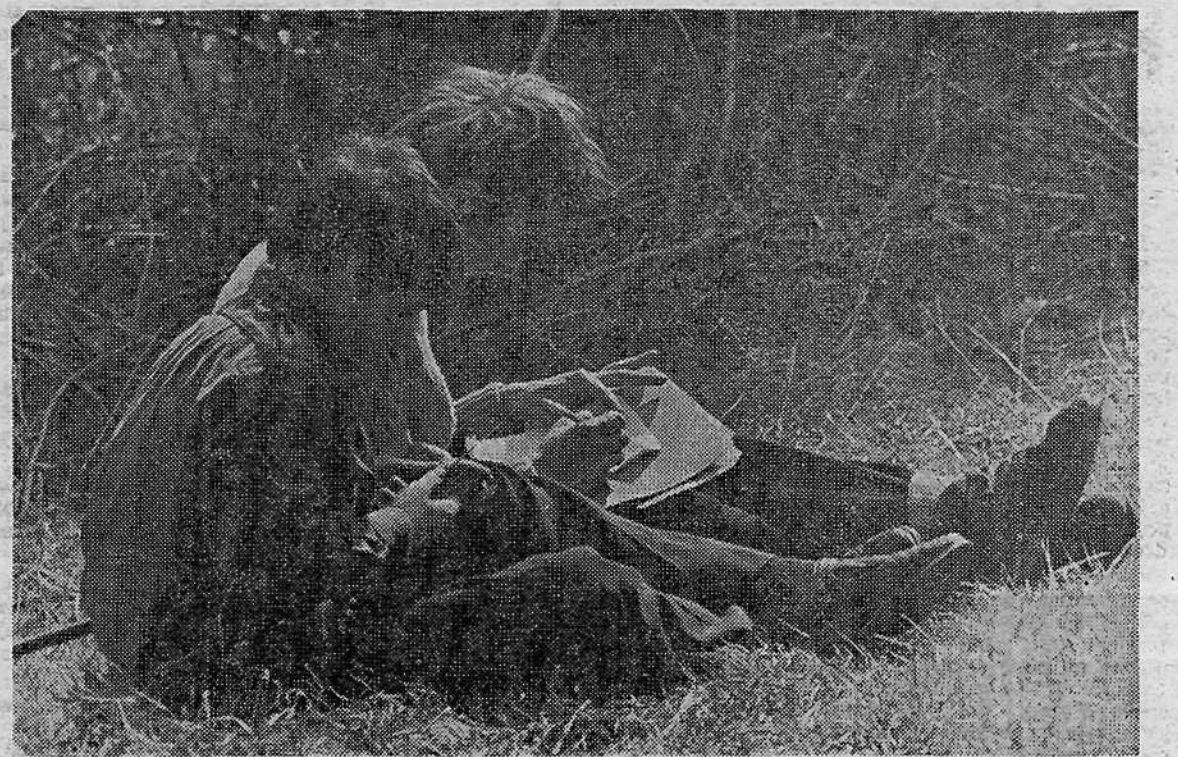
Ali je sploh kaj prav