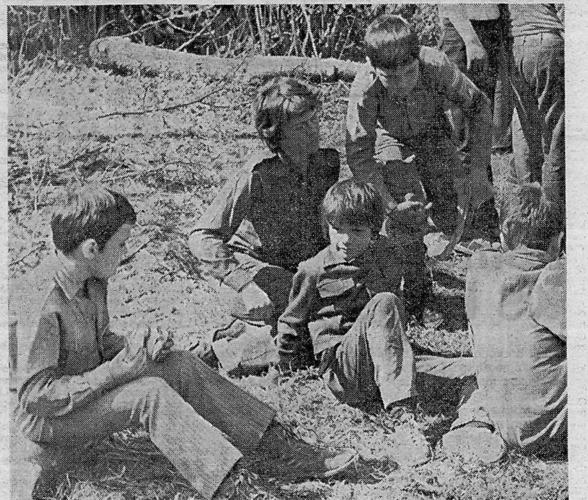
Ali bo gorelo