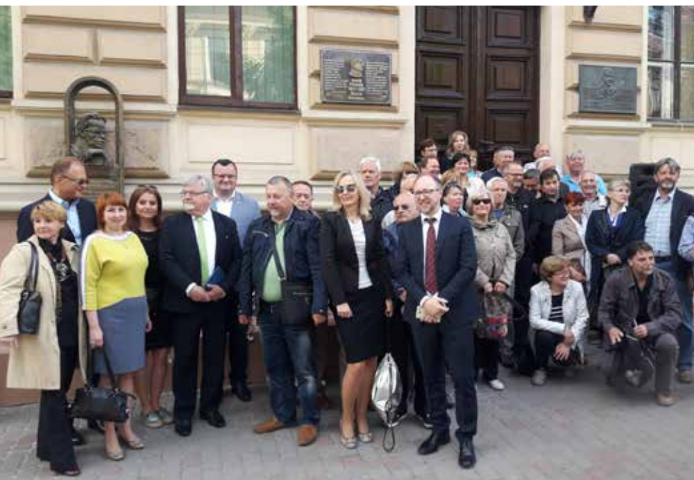
Spominsko obeležje prof. Plemlju v Černovicah, Ukrajina.