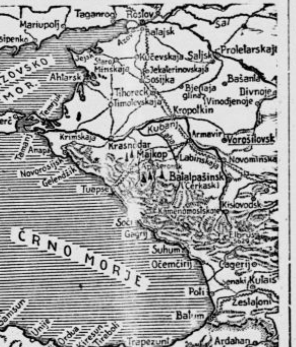
Pri operacijah med Kubanom in Kaspijskim morjem se je posrečilo nemškimi oddelkom prodreti globoko razčlenjeno in

Iz Hitlerjevega glavnega štapa, 22. sept. Vrhovno poveljništvo nemške vojske je objavilo danes naslednje poročilo: »Severozapadno od Novorosijska se je skušal sovražnik v noč na 21. septembra izkrcati iz brzih čolnov in podmornic. Poiskus so zavrnile edince vojnega mornarice. Letalstvo je bombardiralo sovražnikove postojanke pri Gelendžiku in ladijske cilje pri Tuapseju.