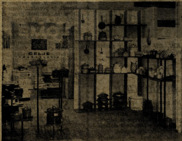
Razstavni prostor na sejmu v Lyonu

kazala zelo širok asortiman emajlirane posode težje izvedbe v najrazličnejših barvah in dekorjih — prevladujejo pa predvsem pastelne barve. V proizvodnji težje vrste posode so napravili kvalitetni skok češki proizvajalci. Iz tega sledi, da bomo morali tudi mi posvetiti večjo pozornost izdelavi naše special posode posebno kar se tiče pastelnih barv in dekorjev.