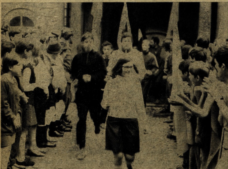
V mesecu mladosti je vsekakor osrednja manifestacija Titova štafeta — v verigi mladih rok je tudi desnica tele celjske mladinke