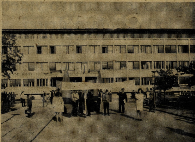
Na osrednjo proslavo 50-letnice KPJ, ZSJ in SKOJ so odšli v povorki tudi člani našega kolektiva

mladih komunistov in neaktivnost mladega komunista v mladinski organizaciji. Delo aktiva mladih komunistov v delovni organizaciji pa je bilo v večji meri pohvalno, saj ti aktivni obravnavajo med mladimi probleme, s katerimi se bori delovna organizacija. Problemi razdeljevanja osebnih dohodkov so bili splošna polemika zaradi nepravilne razlike v osebnih dohodkih proizvodnje in neproizvodne politike nagrajevanja. Tema o volitvah v samoupravne organe in za občinske kandidate je v nekaterih delovnih organizacijah lepo uspela in se je pokazalo, da ima mladina vidno vlogo v taki dejavnosti in da ima mladina enakovredno uveljavitev. Glede same reorganizacije ZM pa je vladalo mnenje, da smo s tem, ko smo reorganizirali ZM pridobili širše zajeto področje mladincev in njihove interese, kar naj bi bil dokaz večje organiziranosti mladincev in mladink. Klubi in krožki pri predsedstvu ZM Celje so uspešno delali, naj