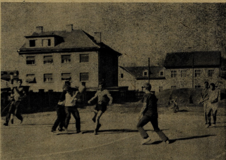
Detajl iz polfinalnega srečanja med upravo in predelovalnico kovin

V polfinalu so se srečali: predeloval. kovin : uprava 3:1 emajlirnica : montaža 3:0 Finale: