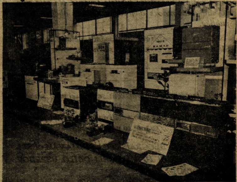
Peči — zanje je bilo na zagrebškem velesejmu ogromno zanimanja

Naši izdelki so vzbudili veliko zanimanje pri obiskovalcih posebno zaradi barv. So pa glede kvalitete zelo občutljivi in smatrajo posodo, ki ima na zadnji strani dna vidne sledove konic žgalnih rešetk kot sekunda kvaliteto. V Južni Franciji živi mnogo priseljencev iz Tunisa, Alžira in Maroka in ti poznajo našo posodo posebno kotličice, čajnike in turške kavovarje, vendar so trgovci — pri-