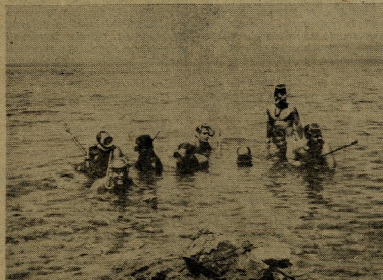
Posnetek je spomin na minulo akcijo naših »tauharjev«. Kmalu bodo posnetki spet sveži in fantje bodo imeli za sabo še en podvig krožka.