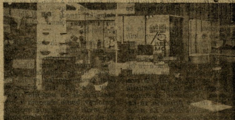
O naših pečeh Slovenci veliko vedo — bolj je obiskovalce zanimal kotel 30 T

In še beseda o samem razstavnem prostoru — bil je velik, zelo lepo urejen, pokazali smo veliko in mnogim obiskovalcem. Čeprav nekateri proizvajalci temu sejmu ne posvečajo tolikšne pozornosti, pa je, čeprav morda ne iz stališča komercialnih rezultatov, pomemben kot potrošniško informativna razstava in udeležba — še posebej, ker smo imeli po mnenju mnogih prav mi najlepši razstveni prostor — komistna.