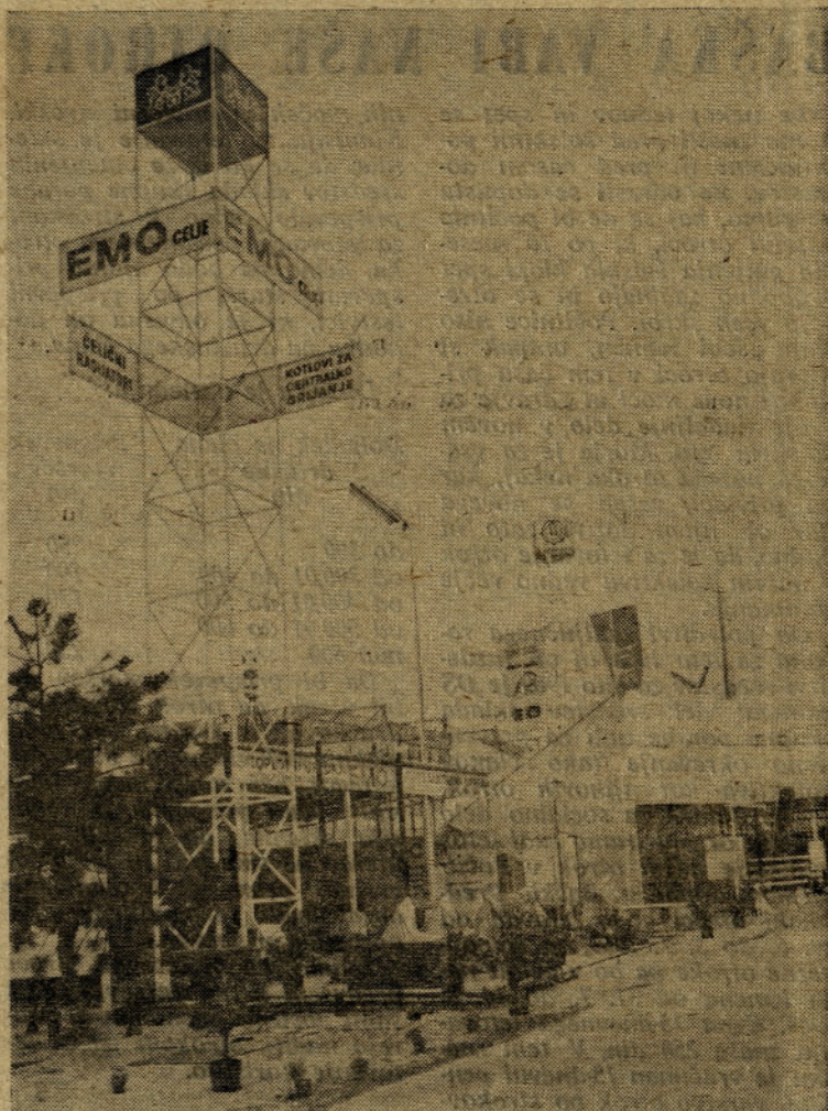
Naš zagrebški zunanji prostor — toplotne naprave

V nasprotju z izrednim zanimanjem za peči na zagrebškem pomladanskem velesejmu, lahko trdimo, da Slovenci o pečeh domala vse vedo. Propagandna akcija minulega leta 8 + 5 torej prinaša sadove prizadevanj in vložnega denarja in je do-