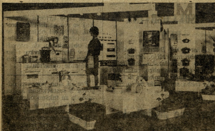
Alpe Adria 1969 — imeli smo celo lutko, ki je varovala »kuhinjski« del razstave

ra, laže jih je čistiti, pa tudi lepši so. S proizvodnjo pa bomo morali pohiteti, saj je bilo na sejmu slišati, da jih bodo začeli v kratkem izdelovati prav na veliko v nekem srbskem podjetju.