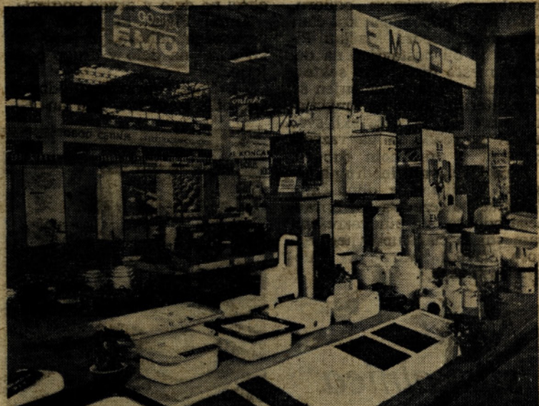
Razstava naše sanitarne opreme na sejmu v Zagrebu

Grazu organizirata Gospodarski zbornici iz Ljubljane in Zagreba ter urejujeta izmenjavo blaga v okviru sejemskih sporazumov. Naše podjetje vsako leto razstavi nekaj svojih izdelkov na tem sejmu, ki je sicer bolj lokalnega značaja, vendar pomemben za utrjevanje naših poslovnih odnosov z nekaterimi pomembnimi firmami kot so