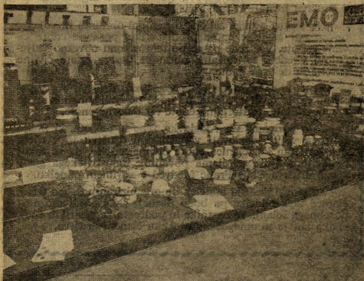
Takole je izgledala naša razstava posode v Zagrebu

Na zunanjem prostoru so tako med strokovnjaki kot med samimi graditelji vzbujali precej pozornosti panelni radiatorji, saj zavzemajo manj prostora,