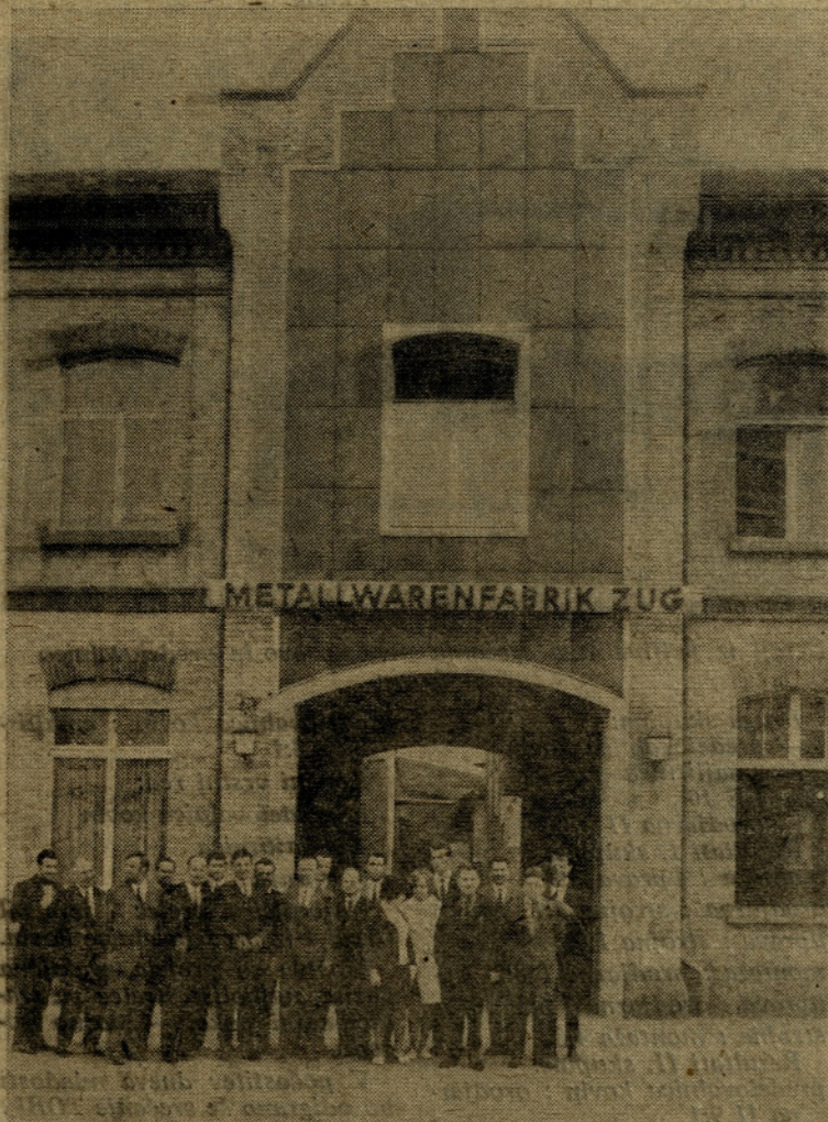
Takole izgleda tovarna v Zugu

V firmi Zug so nas prav pri srčno in prijazno sprejeli in nam pripravili tudi zakusko. Ogled tega podjetja je bil za vse prav zanimiv in koristen, saj prav o tem podjetju doslej nismo prav dosti vedeli.