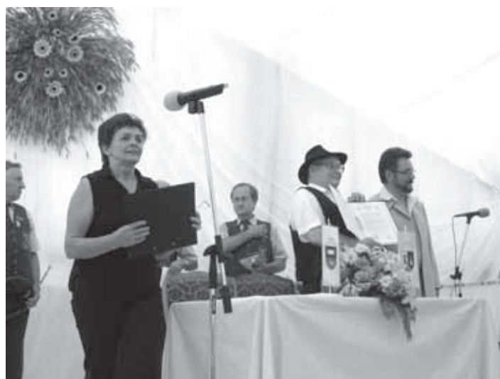
POTRJENO SODELOVANJE MED OBEMA DRUŠTVOMA