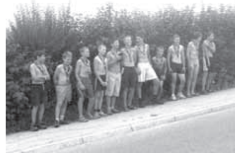
ODKUPNINA ZA IZGUBLJENE ZASTAVE

Pot smo vsi skupaj začeli v petek, ko smo se na pot odpravili kar z avtobusom in vlakom. Čeprav je že v Turjaku, ko smo vstopili na avtobus, močno deževalo, smo bili vsi optimistični in pripravljeni na nove dogodivščine - teh tudi ni manjkalo. V Ljubljani nas je doletela že prva (a ne zadnja), ko smo vstopili in se odpeljali z napačnim vlakom. Ampak skvt se znajde in tako smo vseeno prišli do našega tabornega prostora, čeprav res šele ponoči in čisto premočeni. Prvo noč smo preživeli v župnijskih prostorih, naslednji dan pa smo že postavili taborni prostor (šotore, jambor z zastavami, nabiranje in sekanje vej po gozdu za ogenj ...), kjer smo preživeli naslednje noči. Izvidniki so nas ponoči stražili s stražo in tako varovali naš taborni prostor. Straža je ena izmed velikih iger, ki traja ponoči - vsaki dve uri se straža zamenja, straži pa celotni taborni prostor