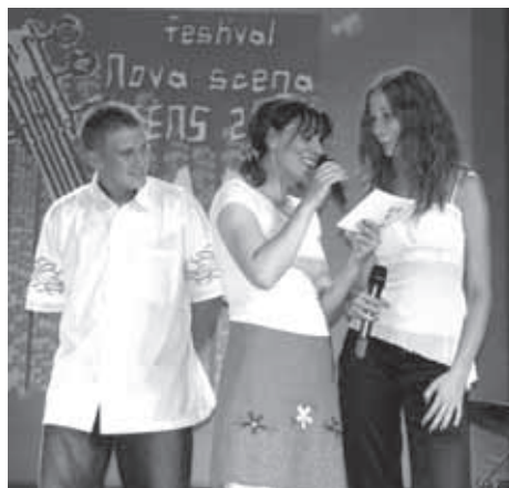
OB RAZGLASITVI REZULTATOV