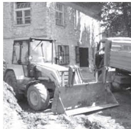
STROJNI ZEMELJSKI IZKOP PRED OBJEKTOM