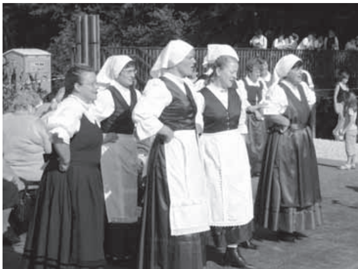
ČLANICE DPŽ VELIKE LAŠČE