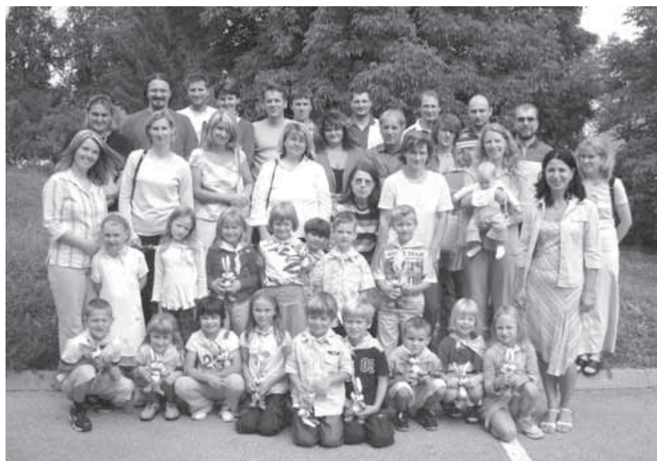
LETOŠNJA GENERACIJA PRVOŠOLČKOV SKUPAJ Z NJIHOVIMI STARŠI IN UČITELJICAMI