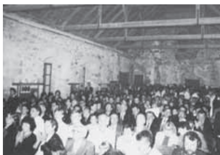
KUD MARIJ KOGOJ JE TUDI V JUNIJU 1991 POSKRBEL, DA SMO OSAMOSVOJITEV DOČAKALI ENOTNO.

Poleg obeležitve teh praznikov ima KUD Marij Kogoj Turjak tudi obveznosti do JSKD Lj. - okolica, saj je še z dvema občinskima KD ustanovitelj le-tega. Samo v zadnjih 15 letih sta KUD Marij Kogoj kot gostitelj in sprva ZKO Vič, potem ZKD Lj. - okolica in od leta 1997 JSKD Lj.- okolica kot organizator pripravila kar 30 območnih srečanj. Na območnih srečanjih JSKD Lj.-okolica, organiziranih v naši občini, sodeluje mnogo društev iz 7 občin. S tem