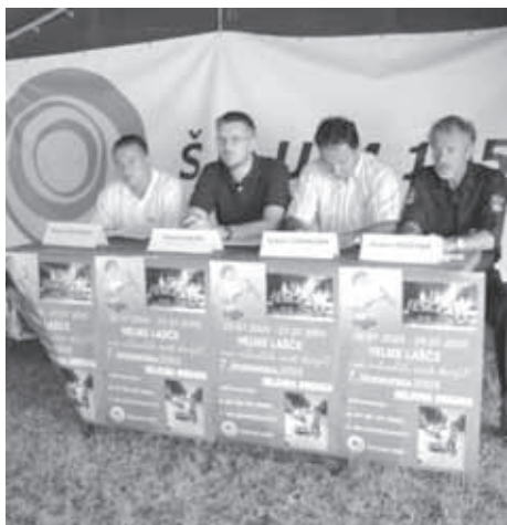
TISKOVNA KONFERENCA Š.O.U.M.