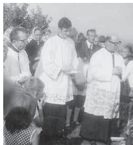
OB BLAGOSLOVITVI ZVONA, 12. JULIJA 1973