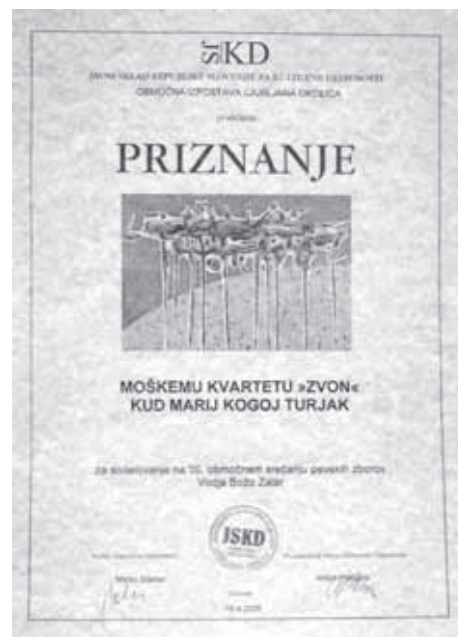
TO PRIZNANJE NAJ BO DOKAZ, DA JE MOŠKI PEVSKI KVARTET ZVON RES NASTOPILO NA REVJI V DOLU.