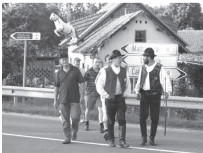
ČLANI KONJEREJSKEGA DRUŠTVA VELIKE LAŠČE

svetniki, članice Društva podeželskih žena Velike Lašče in člani Konjerejskega društva Velike Lašče. V sklopu osrednje slovesnosti je potekalo tudi slavnostno razvitje prapora Turistično-narodopisnega društva Razkrižje, pri katerem so s svojim praporom in v narodnih nošah sodelovale tudi članice Društva podeželskih žena Velike Lašče.