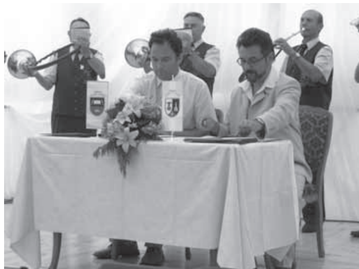
SLAVNOSTNI PODPIS POGODBE

Listina je bila podpisana 3. julija 2005 na osrednji prireditvi ob praznovanju sedmega občinskega praznika občine Razkrižje. Tega svečanega dogodka so se udeležili tudi nekateri naši občinski