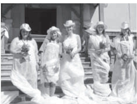
ANIMATORKE - NEVESTE