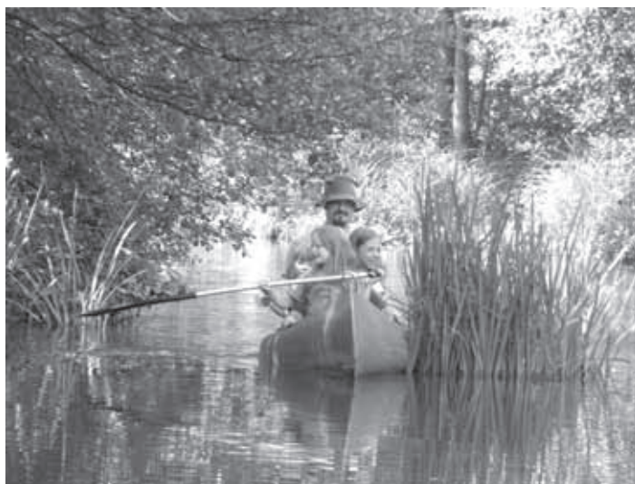
S KANUJEM PO RAŠICI

Agencija republike Slovenije za okolje, urad za opravljanje z vodami, sektor za vodno območje Donave, Oddelek območja srednje Sava, pokriva 4.000.000 km vodotokov, na 3.900 km 2 površine, kar je približno 19 % celotne Slovenije. Naše območje zajema celotno porečje Kamniške Bistrice, Ljubljaniče, srednji del Save do Zidanega Mostu, del Kolpe do Dola. To je 14 upravnih enot in občina Velike Lašče je ene izmed 36 občin na območju našega oddelka.