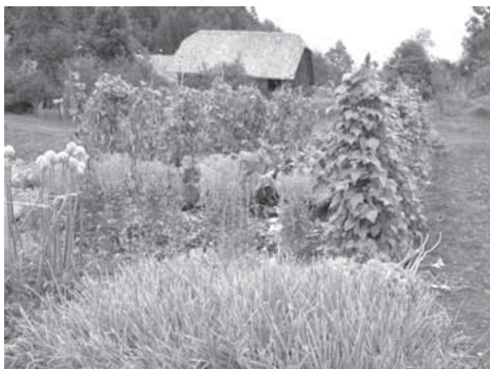
LEPO UREJEN NARAVNI VRT V KRVAVI PEČI. NA NAŠIH KMETIJAH KMETJE ŠE ZNAJO PRIDELATI SEMENA SAMI DOMA.

Enotna označenost in opremljenost poti je potrebna za zagotovitev enotne ravni kakovosti.