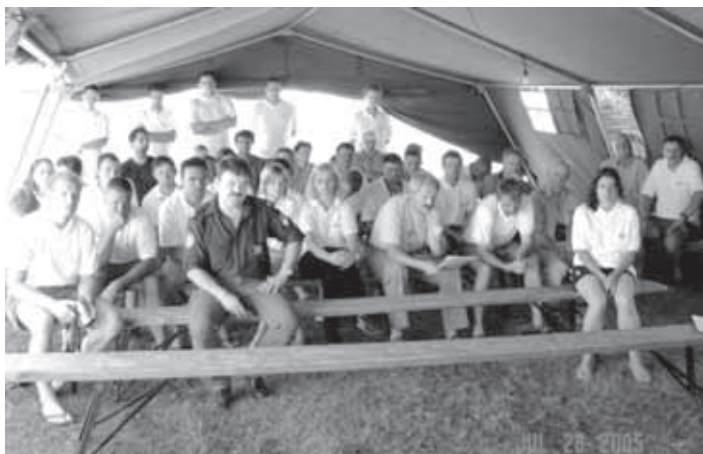
BRIGADIRJI IN BRIGADIRKE NA TISKOVNI KONFERENCI

S pomočjo delovnih strojev, ki jih je zagotovila Občina Velike Lašče, so brigadirji v skladu z odobrenim načrtom bistveno sanirali in izboljšali okolico doma, tako da je objekt zadihal s polnimi pljuči. Pridobljena je velika ravna površina, ki bo lahko služila za večje prireditve in razna tekmovanja. Delovne akcije študentske brigade so potekale po vsej občini.