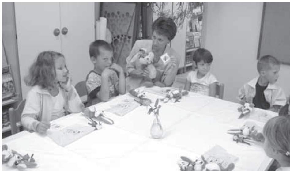
1. SEPTEMBER 2005 - PRVI ŠOLSKI DAN

V prvih dneh bomo veliko pozornosti posvetili našim novinčkom in staršem, tako da bodo čim hitreje in lažje sprejeli novo okolje.