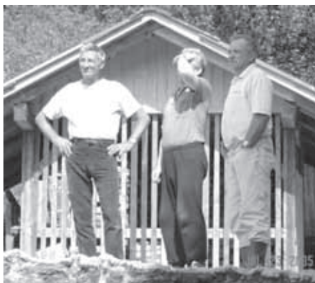
VAŠČANI KRVAVE PEČI OPAZUJEJO DELO

Opravljena so bila razna dela, od barvanja ograj na mostovih lokalnih cest, ravnanja zemljišč in zemeljskih izkopov do obnovljenih markacij evropske pešpoti na relaciji Krvava Peč-Predgozd-Iška, čiščenja okolice vasi in urejanja sprehajalnih poti in fizične pomoči na kmetiji. Urejena in očiščena sta bili tudi okolica in dostop do dveh starih vodnjakov, enega v Krvavi Peči in drugega v Osredku nad Robom.