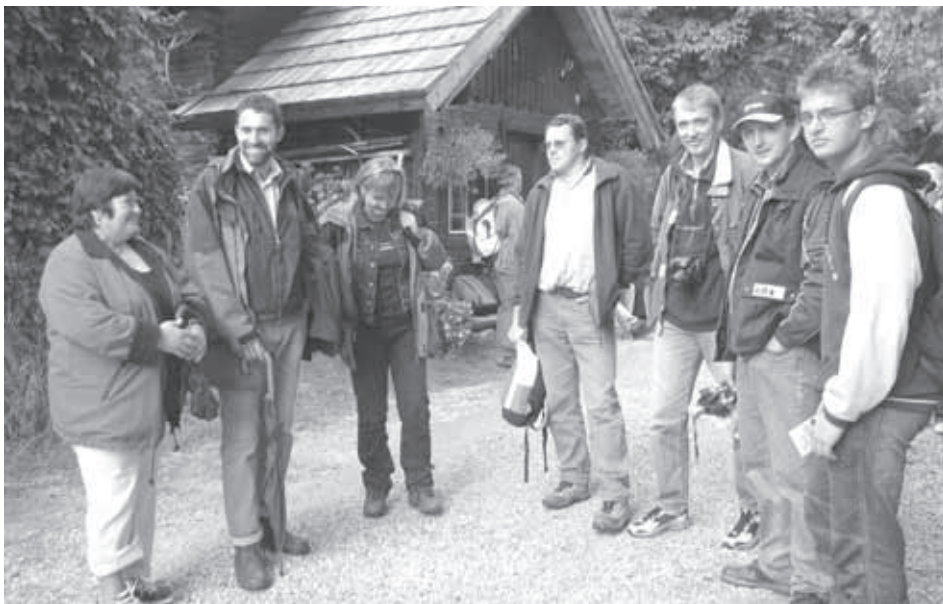
EKSKURZIJE SE JE Z OBČINSKIM KOMBIJEM UDELEŽILA TUDI ODPRAVA IZ VELIKIH LAŠČ.