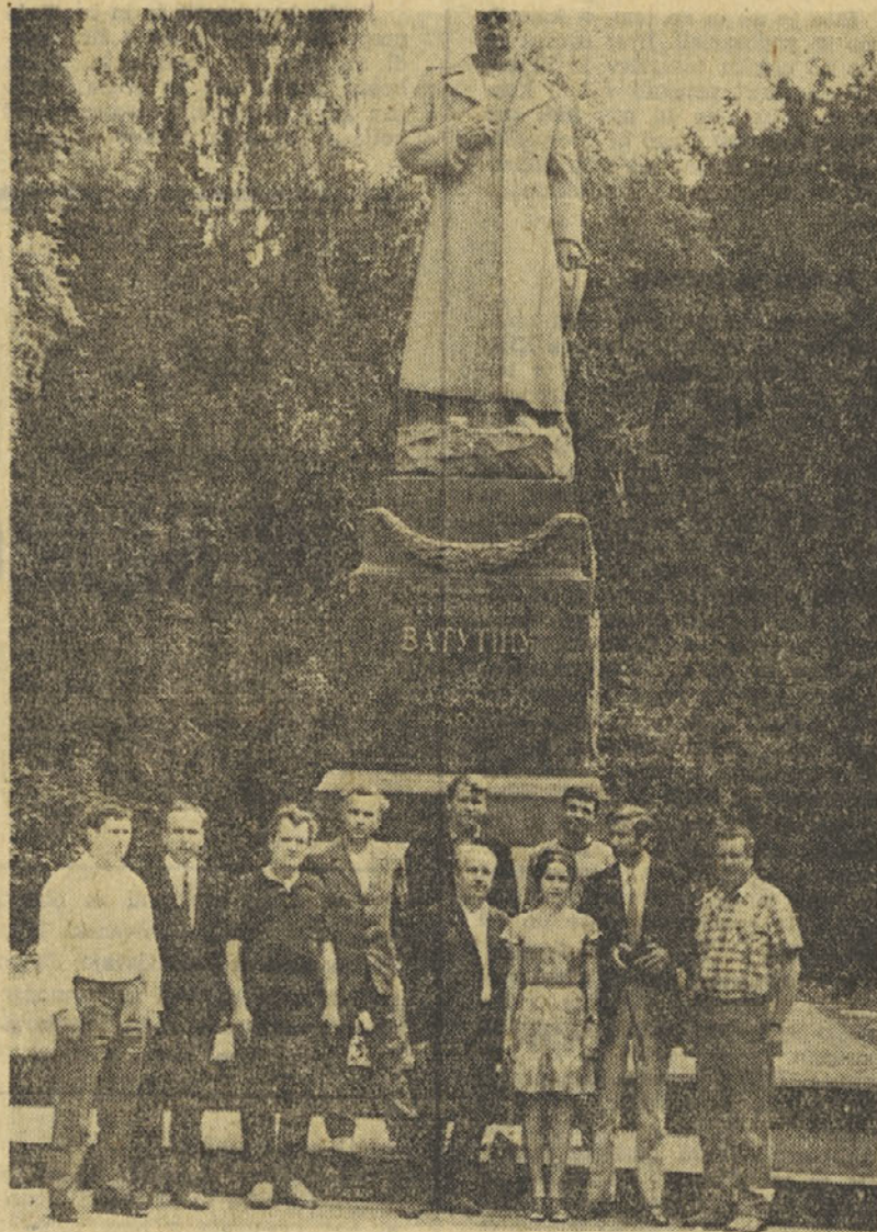
PRED SPOMENIKOM GENERALU VATUTINU — HEROJU SOVJETSKE ZVEZE

smo si ogledali prekrasno vzorčno sobo. Po steklenih izdelkih, ki so v tej sobi, je moč zaslediti razvojne korake tovarne. Med mnogimi izdelki smo videli še dragocene unikate velikih umetniških vrednosti. Na izdelkih so vgravirani liki znanih osebnosti Sovjetske zveze. Za ogled tako bogate razstave tople steklene tvarine je potrebno veliko več časa, kot smo ga imeli na razpolago mi. Vtisi pa so vsekakor nepopisni.