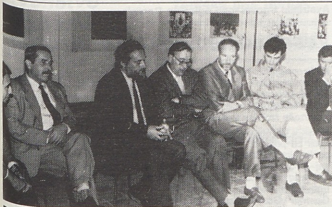
Da v Gorenju namenimo ekologiji kar precejšnjo pozornost, je bil dokaz tudi priprava okrogle mize o ekologiji, na katero smo povabili tudi priznane mednarodne strokovnjake (več na 2. strani).