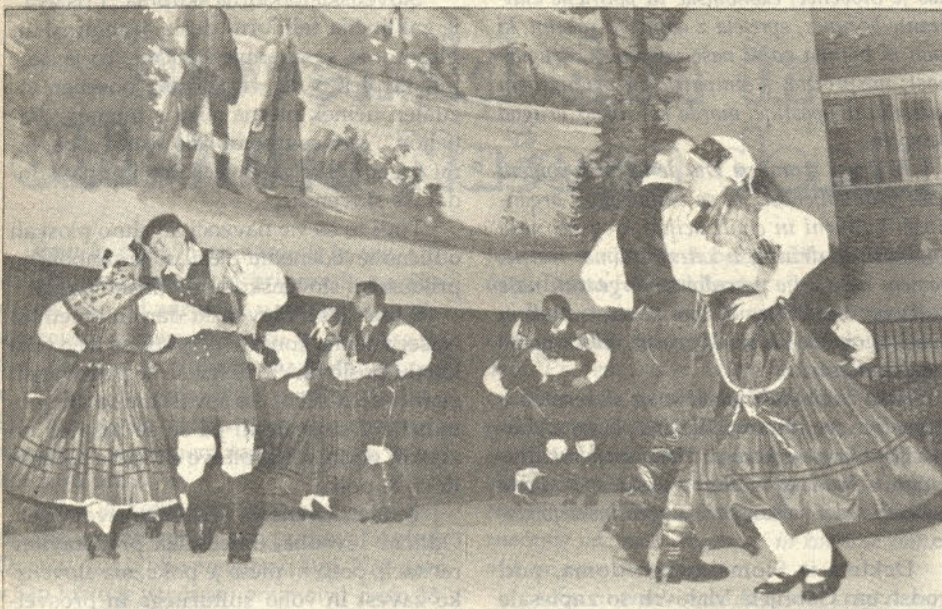
Folklorna skupina iz Slovenske vasi prikazuje gorenjski ples.