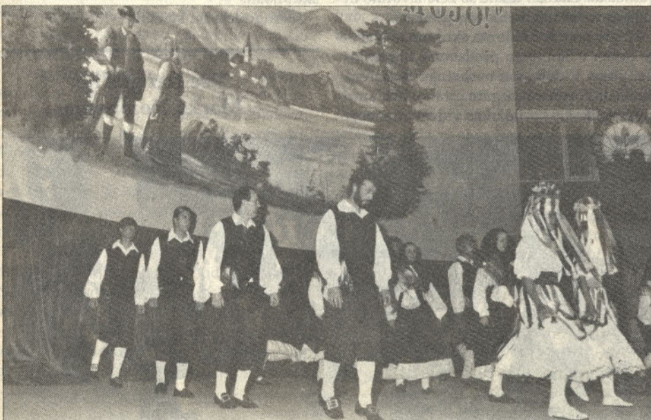
Plesna skupina s Pristave pri plesu iz Rezije.