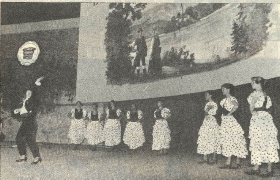
Živahen španski ples, ki so ga pripravila dekleta iz Slomškovega doma.