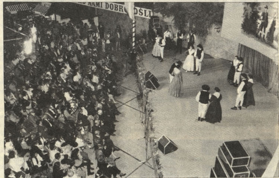
Drug pogled na Maroltovo skupino v bolj umirjenem plesu.

Desno: Izredno gibčni plesalci skupine AFS France Marolt na sanhuškem odru.