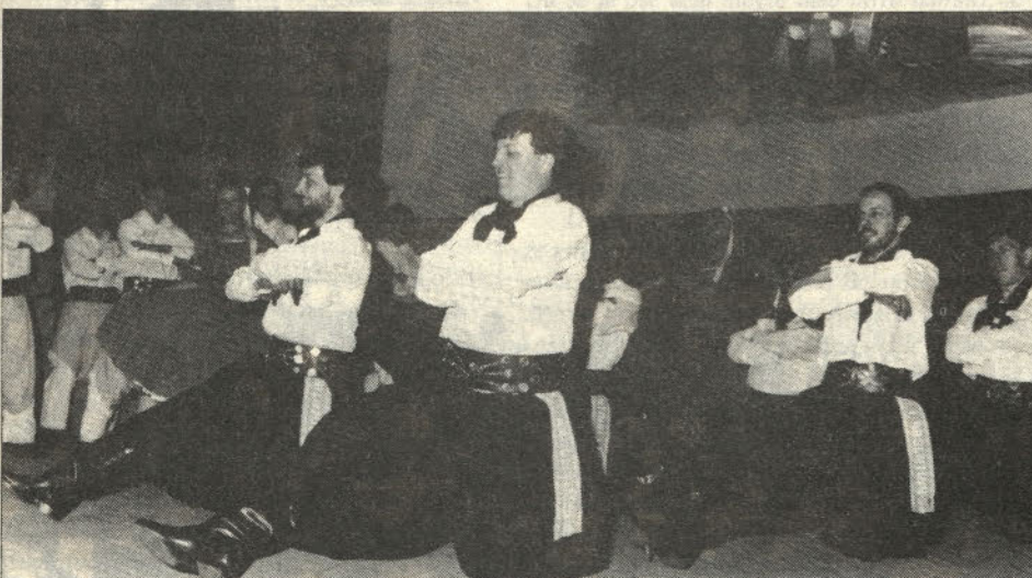
Folklorna skupina iz Našega doma v San Justo prikazuje argentinski ples.

LJUBLJANA — Statistični podatki povedo, da je v lanskem šolskem letu prejelo študentskega skoraj 32.800 študentov (55,4% redno vpisanih študentov) in 100.000 (47,7%) dijakov. Ti podatki kažejo, da se je število študentov zmanjšalo skoraj za 2 odstotka, vendar ne zato, ker bi bil študij cenejši, ampak ker se je zmanjšalo število študentov.