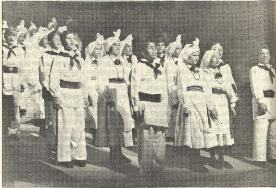
Osnovnošolski otroci recitirajo Gregorčičeve pesmi.

Poleg slovenske šole je zelo važen za obstoj življenja v Domu Mladinski pevski zbor, ki je 17. septembra praznoval 23. obletnico z odlič-