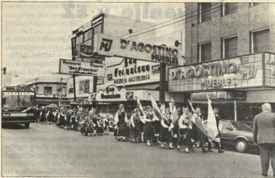
Sprevod slovenskih narodnih noš iz Našega doma v stolnico.