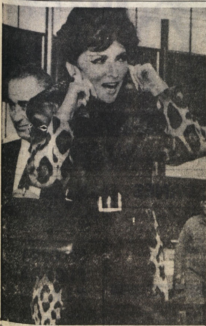
Se vedno lepa Gina Lolobrigida si mišči «nosa» Morda na račun hrupa, ki se je dvignil na Angleškem zaradi njenih sedmih krznatih plaščev in drugod za to, da je njena poroka s Kauffmanom v nevarnosti ker da Kauffman ni bogat...