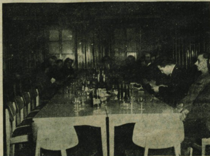
Odlikovanci med zakusko v sejni dvorani ObLO

Po izročitvi odlikovanj je predsednik ObLO zadržal odlikovance na zakuski. Ob tej priložnosti se