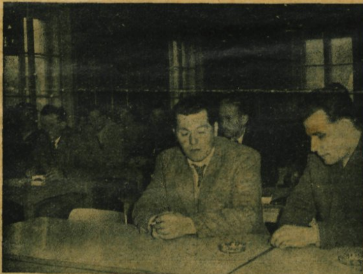
Clani plenuma ObO SZDL na zasedanju

● V vseh krajevnih organizacijah SZDL, gospodarskih organi-