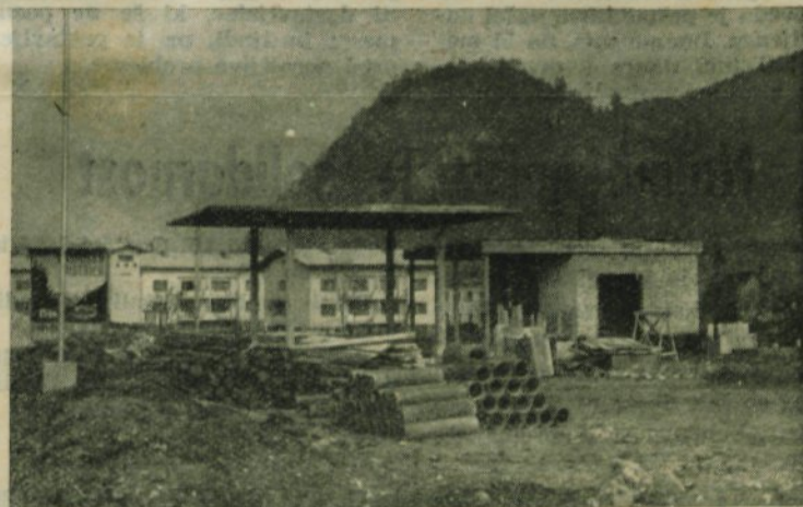
Gradnja nove bencinske črpalke ob Ljubljanski cesti