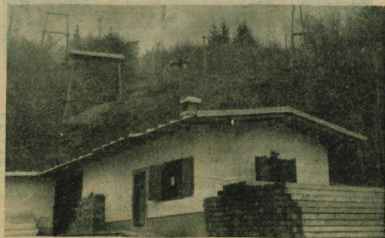
Spodnja postaja tovarne žičnice na Veliko planino, ob njej bo kmalu tekla osebna žičnica. Tovarne žičnice potem ne bodo padli, ampak jo bodo uporabljali za prevoz hrane in drugega materiala

Prav gotovo bomo dela na žičnici lahko končali do jeseni. Seveda pa bomo morali hkrati postaviti gostišče pri zgornji postaji.