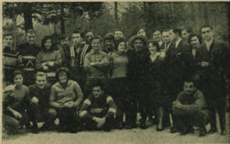
Udeleženci mladinskega seminarja na Kopiših

Mnogo razprav je razčlenjevalo arondacijo zemlje, ki ima tudi v mladih močan odraz. Vprašamo se: ali je SZDL napravila vse za predviden pristop k ljudem in jim dovolj pojasnila konkretne možnosti novih proizvajalcev na zemlji?