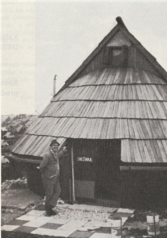
Problem kočice Snežinke se bo seveda rešil sam od sebe. Potrebna je le dobra mera potrpljenja. Kočica Snežinka namreč ne bo več dolgo vzdržala.