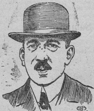
G. v. Jagow

Nemški državni tajnik v zunanji službi Gottlieb von Jagow je glasom časniskih poročil odstopil. Prinašamo sliko tega veleza-sluznega uradnika.