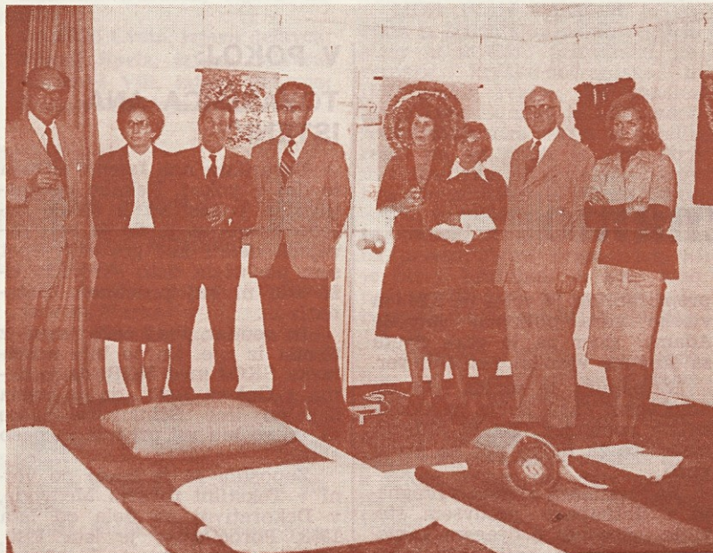
Na otvoritvi ...