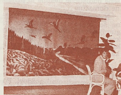
»Fazani« so bili tarča občudovanja ...

Mnenja občinstva na razstavi so se srečevala zlasti v tem, da je sama razstava tudi posrečena in koristna reklama za Dekorativno. Vsekakor so se obiskovalci lahko tako dobro seznanili z izdelki in možnostmi naše ročne tkalnice, da se je marsikdo kaj hitro odločil za naročilo — bodisi pregrinjala, preproge ali prta, še posebno, ker so cene kljub ročni izdelavi (tudi po besedah obiskovalcev) še dostopne.