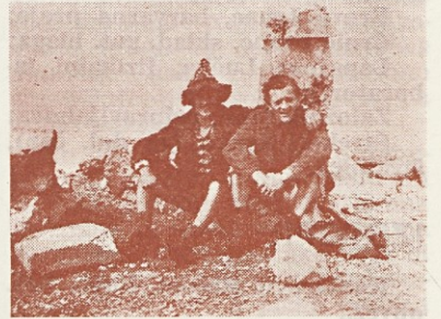
Avtor članka s prijateljem — za spomin

S sedla smo se spustili na drugo stran, dež pa je medtem »rodil« številne potočke, ki veselo žubore v dolino Bistrice. Spodaj smo se ponovno zbrali in