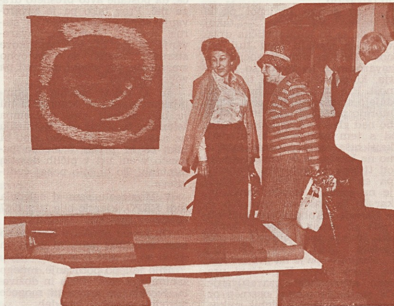
Zanimanje in presenečeni pogledi ...