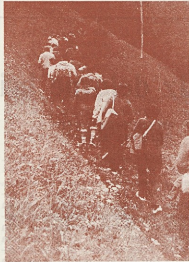
Vrsta je bila kar dolga in prvi v vrsti so morali kar pohiteti...

Nam, ki smo ostali v koči, se je zdelo prav lušno, saj smo bili na toplem in tudi žlahtne kapljice ni primanjkovalo. Takoj smo vsi postali prijatelji. Razpoloženje se je razdelilo; za prvo mizo so moški »vrgli karte«, za drugo mizo pa so ženske pripovedovale šale pa tudi zapele narodne in planinske. Razumeli smo se vsi, da je kaj — »vse zmoremo, le vremena popraviti ne znamo,« je bila šala in — tudi resnica.