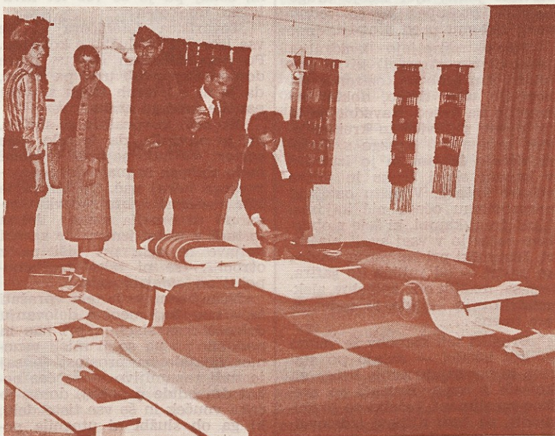
Se da tudi naročiti? ...

Minuli mesec je bila pri Kompasovi turistični poslovalnici na Titovi cesti v Ljubljani razstava ročno tkanih izdelkov Dekorativne. Na ogled so bile tapiserije, posteljna pregrinjala, blazinice, preproge in prtiči.