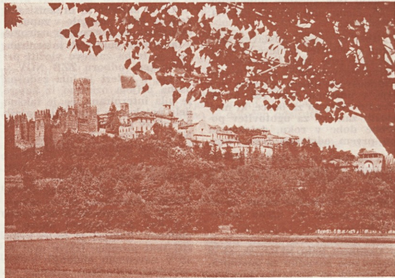
Castell'Arquato, kjer nas je lepo sprejel lastnik velike vinske kleti...