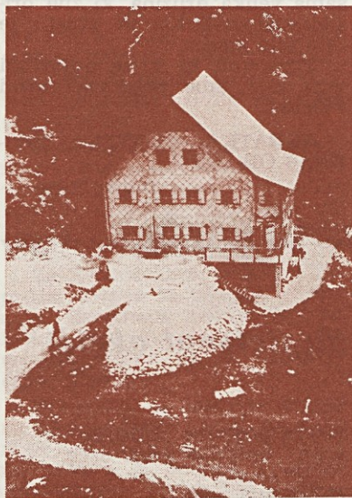
Pogled na Cojzovo kočico je bil mamljiv, zlasti za lačne...

V koči sem izvedel mini anketo med najmlajšimi in najstarejšimi. Ker pa so bili vsi odgovori pritrilni, je ne objavljam v celoti, temveč le povzetek. Odgovori kažejo na profil planinca, ki si poleg uživanja v hoji ter