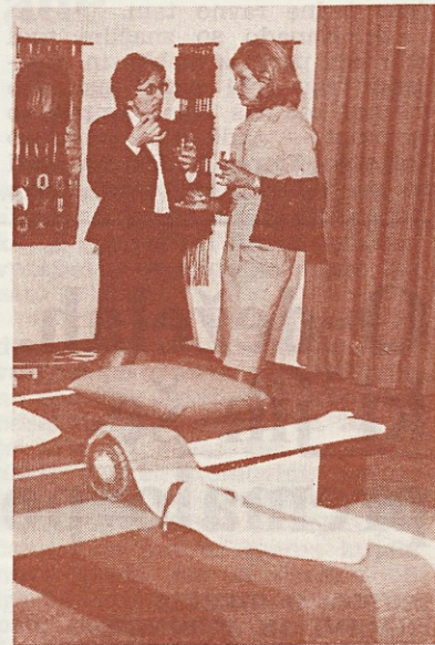
Novinarko zanima še to in ono ...

tudi malo bolj zahtevnih stvari, ki seveda niso izvedljive v redni proizvodnji.