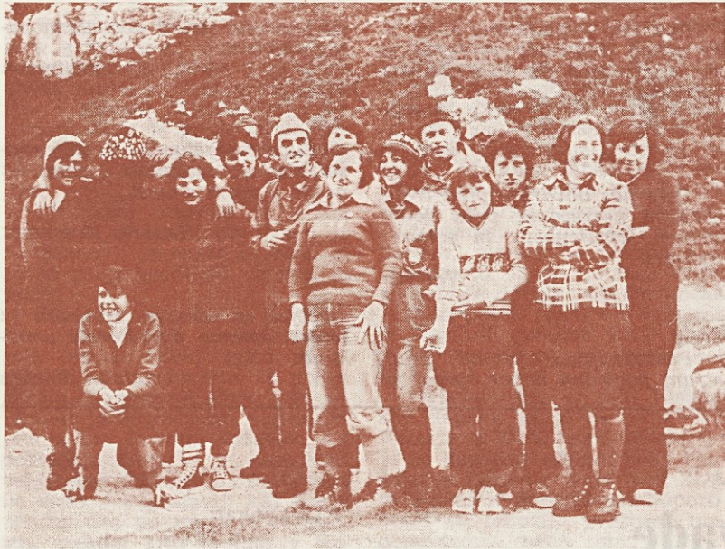
Bilo je lepo, nasmeh za spomin na sliki pa mora biti...

Kam, kam bi se človek dal, kam naj bi izginil, da bi se rešil tržniške gneče? Prijatelj, pritegni partnerje v družbo, da nas bo več! Nad jedilnico, na glavni oglašni deski, je skoraj mesec dni visel plakat »Vabilo v planine«.