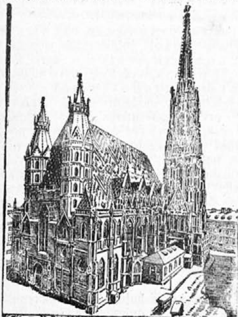
Cerkve Sv. Štefana na Dunaju.

Dedščina Jezusa Kristusa se širi z neverjetno hitrostjo. Malo časa po odhodu Izveličarjevem je praznoval evharistični Kristus-svoj vhod v Rim, v glavno mesto tedanjega sveta. Tisoči in tisoči so hiteli zraven in zahtevali delež njegove dedščine. Stoletje je sledilo stoletju, preganjanje kristjanov se je vrstilo drugo za drugim, sto tisoči so padali v boju kot verni branitelji dedščine Jezusa Kristusa! In vendar kakšen čudež! Dedščina se vedno širi hitro kakor ogenj v vse dežele in med vse narode. Čim huje in strašneje je preganjanje divjalo, tem tesneje so se oklepali pre-