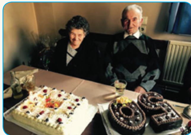
50. obletnica pri Bruožini stran 8