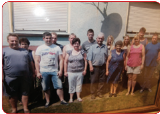
Vsi mlajši pa vnuki

nača moram biti, te je še tam tö bejo tanač. Tau so mena pozabali goranapisati, gde je rendör (policaj) doma bejo, tam moram stanti pa njega tö moram pelati. Gda tapridem,