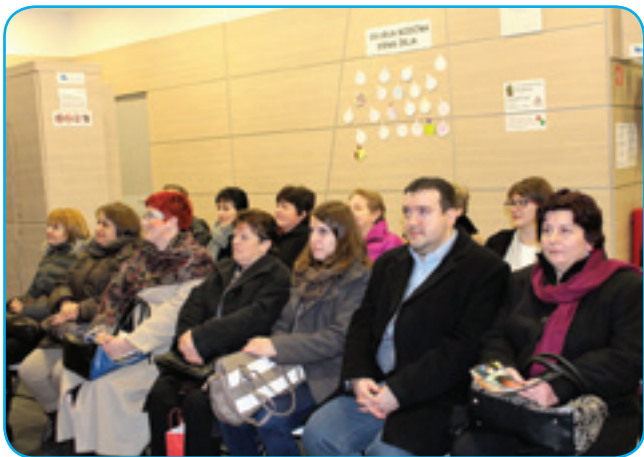
Pedagoški delavci so obiskali Vulkanijo v Gradu

nimanjem ogledalo graško atrakcijo. Seveda nas je po podzemlju vodil Oli – prijazna maskota doživljajskega parka. Ob izhodu pa nas je čakalo presenečenje –