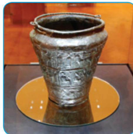
Mala železna situla s človečimi pa stvarinskimi figurami

V takzvanom »halštatskom« cajti so stari lidgé že poznali železo, štero je prišlo iz Male Ažije. Brž so gorprišli, ka ga nej trbej nutpripelati, liki ga leko sami vökopajo. Tak se je formirala domanja metalur-