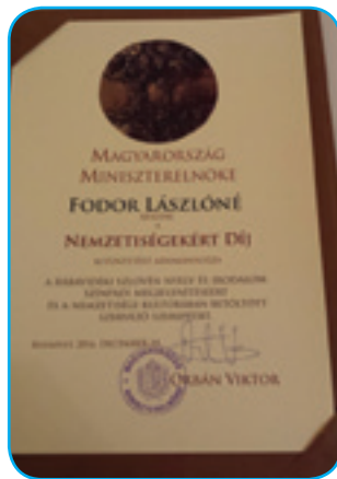
Listina o »Nagrađi za narodnosti« s podpisom predsednika vlade Viktorja Orbana