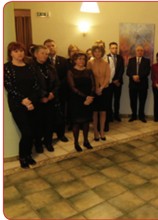
Monoštrskega sprejema ob dnevu samostojnosti in enotnosti Slovencev v zamejstvu in tujini

vsem porabskim nagrajencem. Ta narodnost je zelo majhna, kljub temu pa ima izredno aktivne posameznike in društva.