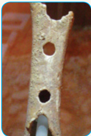
...kak liki bi igro na žveglau... stran 9