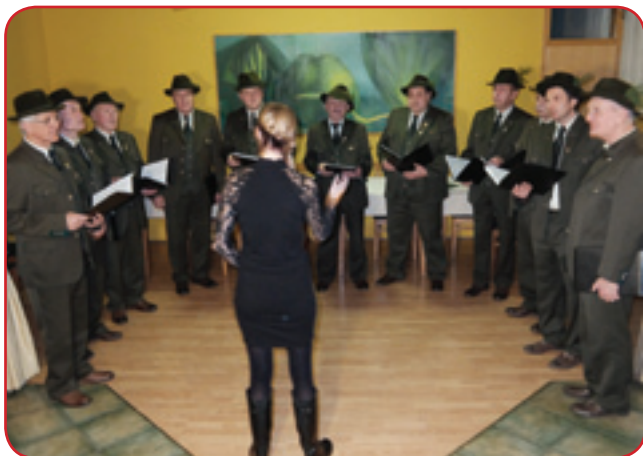
Slavnostni dogodek so s svojim ubranim petjem popestrili člani Pevskega društva Prekmurski lovci

Slavnostni dogodek so s svojim ubranim petjem popestrili člani Pevskega društva Prekmurski lovci, ki se ob slovenski lovski pesmi družijo že 30 let.