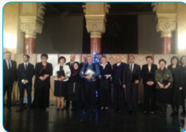
Slovenska rejč mi pride iz srca... stran 6-7