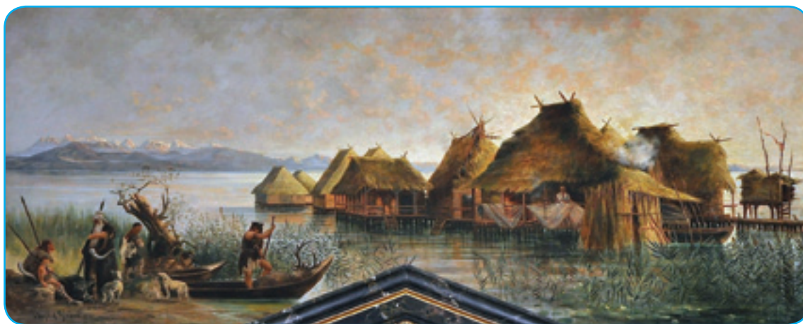
Koliščarska vesnica na kejpi Augusta Grosza

Par lejt nazaj ste leko v naši novinaj dosta šteli od krajin Slovenije, pelali smo se od Goričkoga do Pirana na maurdji. V našoj nauvoj seriji ranč tak leko dosta zvejte od Slovenije pa Slovencov, liki zdaj bole o njini indašnji cajtov. Naša zgodovina se začne te, gda je prvi človek – šteri je eške nej Slovenec biu – stau-po na tau zemlau pa pela do najnovejši cajtov v Evropskoj uniji. Pojte z našim mašinom v dalečnje čase!