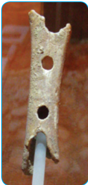
Žvegla z medvedove čonte (djama Divje babe)

V najstarejši cajtaj človečanstva, gda so naši starci zvekšoga samo edna špila nature bili, je že živelo indašnje lüstvo na gnešnjom Slovenskom. Dvej kameni škeri, šterivi sta najstarejšiva spomina, so najšli v Jami v Lozi pri Oreheki, nej daleč od varaša Cerkno. Škeri sta starivi več kak 250 gezero lejt. Čonte kisnejšoga človeka,