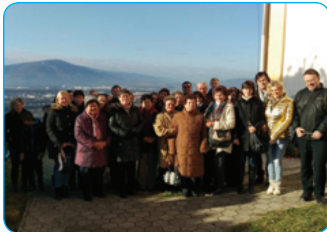
Sakalovčani s tamkajšnjim župnikom

lopa, zvonik, ladja in prezbiterij z dvema baročnima kapelama, prizidanima na južni in severni strani in s prav tako na severni strani priključeno zakristijo. V letih 1860–1864 so cerkev v celoti obnovili. Slika-rija na stenah nam kaže prizore iz Marijinega življenja. Glavni oltar je iz 19. stoletja, narejen