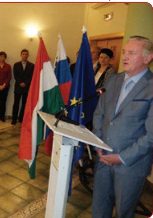
nosti Republike Slovenije se je udeležil tudi minister za po svetu Gorazd Žmavc

ko Brazilije do Kanade. Slovenci namreč na vseh kontinentih ohranjajo jezik in identiteto, je zaključil Gorazd Žmavc, ki je z