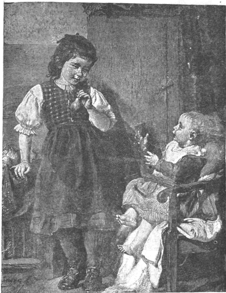
▷ Prva hruška ◁