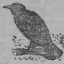
Krokar: 80 let