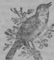
Slavček: 12 let