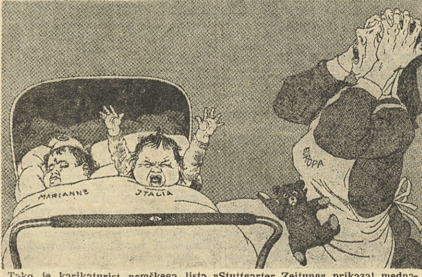
Tako je karikaturist nemškega lista »Stuttgarter Zeitung« prikazal mednarodni položaj v zahodni Evropi. Nemce je francoski odpor proti oborožitvi zahodne Nemčije...