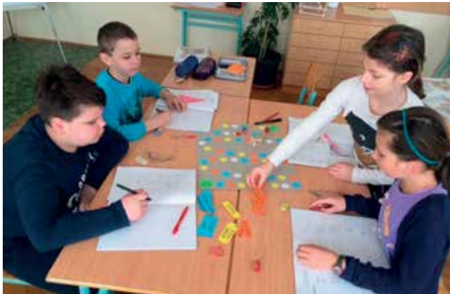
► Matematična igra