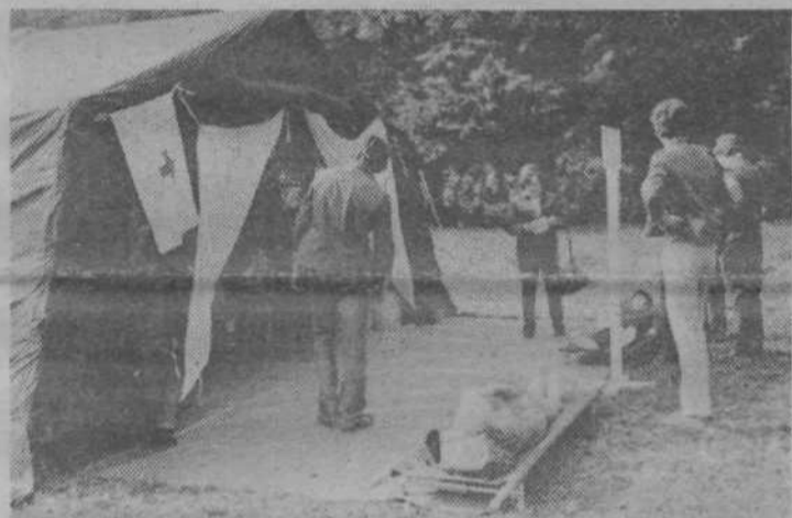
Pred bolnišničnim sprejemnim centrom