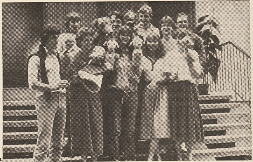
Igralci skupine „lutke mladje“ po 200. predstavi