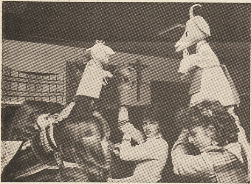
Pogled za kulise med predstavo „Volk in kozlički“