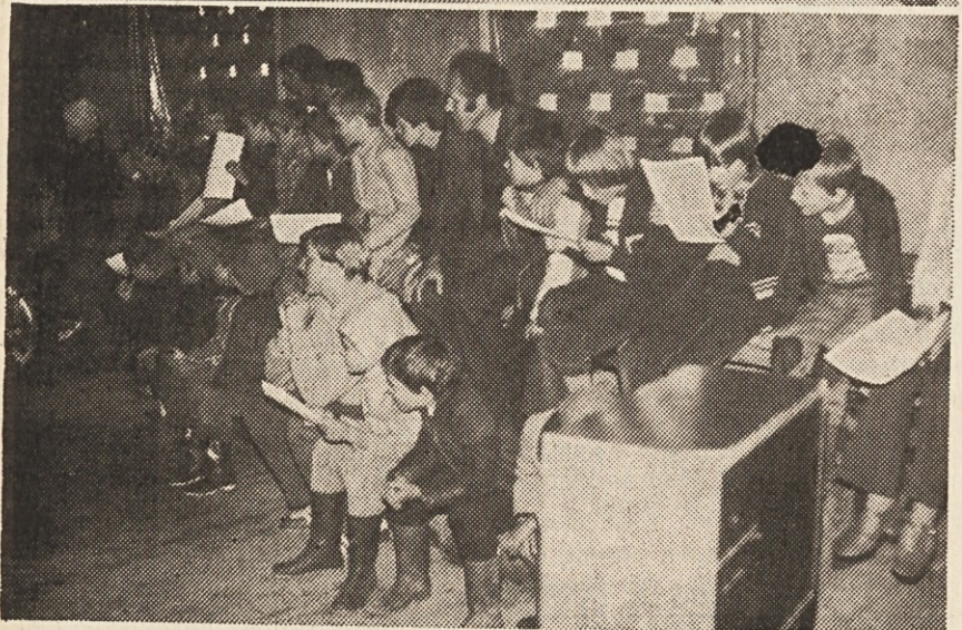
Jubilejna predstava „odra mladje“ KDZ na skednju (zgornji sliki); prva generacija kulturne skupine KDZ (spodaj)