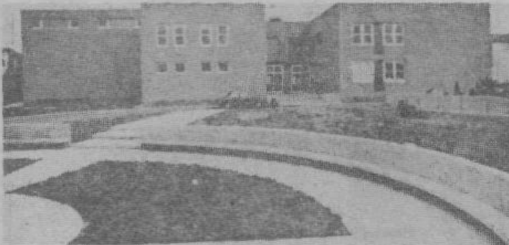
Nova devinska osnovna šola.