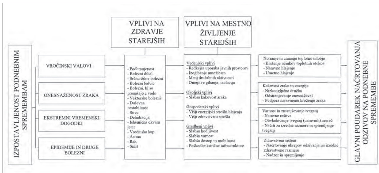
Slika 1: Izpostavljenost podnebnim spremembam in glavni poudarek pristopov v grajenem okolju z vidika starejših (ilustracija: avtorici na podlagi pregleda literature)

jo stroške, kar ne reši ničesar. Za doseganje bolj enakovredno porazdeljenih koristi v družbi in večje učinkovitosti so najprimernejši urbanistični ukrepi na več ravneh hkrati (Milan in Creutzig, 2015). Najpogosteje se v zvezi z največjim tveganjem za zdravje – tj. z vročinskimi valovi, ki jih še krepí učinek mestnih toplotnih otokov – obravnavajo gradbeni materiali, svetloba, geometrija naselij in zelenje. Materiali z visoko svetlobno odbojnostjo, svetle barve ter zelene strehe in fasade zmanjšujejo pregrevanje površin (Milan in Creutzig, 2015; Francis in Jensen, 2017). Tudi ulice, poravnane s smerjo vetra (vetrni koridorji), prispevajo k pasivnemu hlajenju in zagotavljajo svež zrak (Ren idr., 2018). Dostopne in neprekinjene zelene osi so tudi učinkovita rešitev za hlajenje (ker dajejo senco) in širjenje naravnih rešitev po mestu na podlagi združevanja pristopov ekologije in prostorskega načrtovanja. Tudi zelena in modra infrastruktura kot naravna rešitev pomagata izboljšati kakovost zraka, saj delujeta kot ponor ogljika, z bolj propustnimi površinami preprečujeta poplave in izboljšujeta mestni ekosistem (Scott idr., 2016; Depietri in McPhearson, 2017; Frantzeskaki idr., 2019).