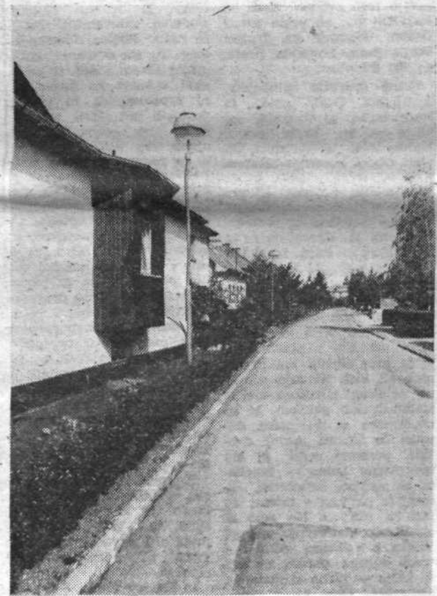
V Celjski ulici so namestili nove luči javne razsvetljave.