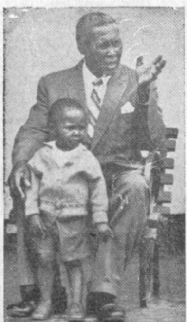
Luthuli bo šel v Oslo. Toda tam bo govoril. Govoril pa bo o strahotah diskriminacije... ne o Vikingih!