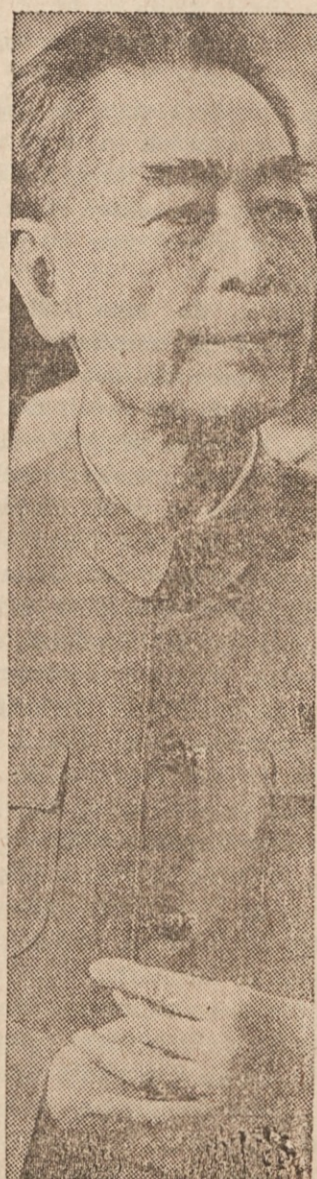
TUDI NJEMU SE POZNAJO LETA — Predsednik vlade L. R. Kitajske Ču En-laj je 72 let star, pa še vedno poln podjetnosti, kot trdijo tisti, ki so govorili z njim. Toda leta se tudi njemu poznajo in prej ali slej bo moral svoje delo omejiti.

Tekom razprave o francoskih atomskih poskusih in o potrebi francoskega atomskega orožja je E. Faure javno dejal, da njegovo preskušanje in gradnjo podpira iz mednarodnopolitičnih in diplomatskih razlogov, četudi v vojaškem pomenu za Francijo ne predstavljajo kaj prida v po-