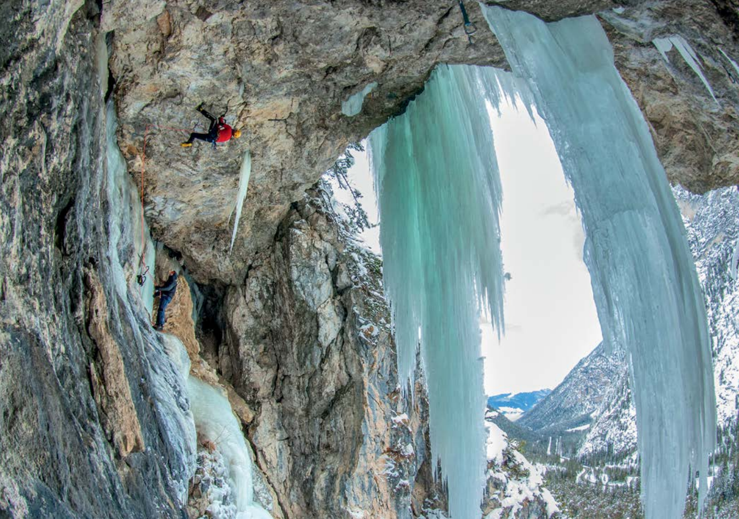
Smer Mix isch fix, M10+, vzpon na flash, v jami di Landro v Italiji