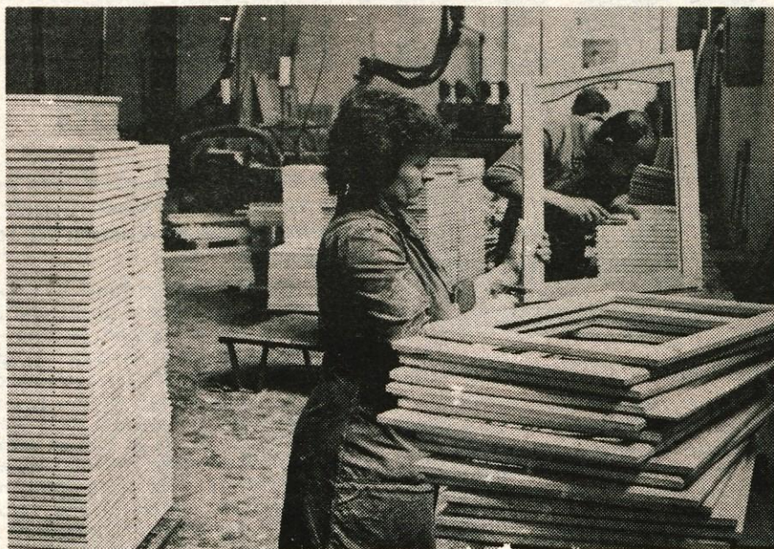
V posodobljeni Zlitovi proizvodnji pohištva zaenkrat še ne dosegajo pozitivnega poslovnega rezultata, vendar si boljše bodočnost obetajo prav od zahtevnejših izdelkov visoke kakovosti. O tem so se med drugim pogovarjali komunisti iz tovarne z delovno skupino CK ZKS, ki je minulo sredo popoldan obiskala ta tržiški delovni kolektiv. (S)