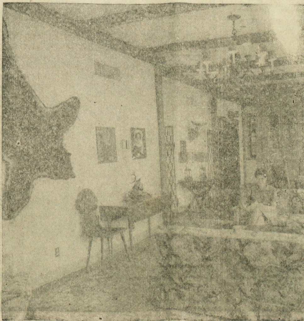
BOLNICA? — Slika kaže "Bavarsko restavracijo" v 17. nadstropju stolpnice v St. Louisu, kjer je nameščena moderna bolnica.

Hiša naprodaj Dvodružinska hiša, v dobrem stanju, je naprodaj na 988 E. 77 St. Kdor se zanima naj kličite MA 1-4800. (117)