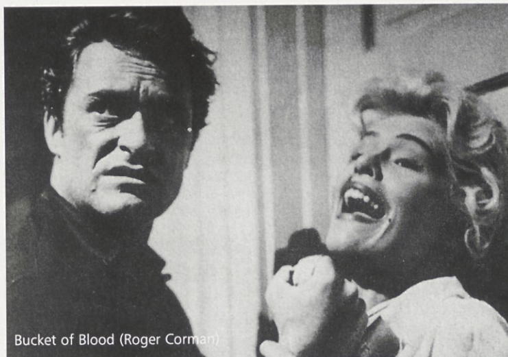
Bucket of Blood (Roger Corman)

Marines (1945), The Red House (1947), Dark Passage (1947), Task Force (1949).