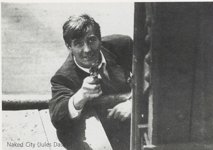
Naked City (Jules Dassin)