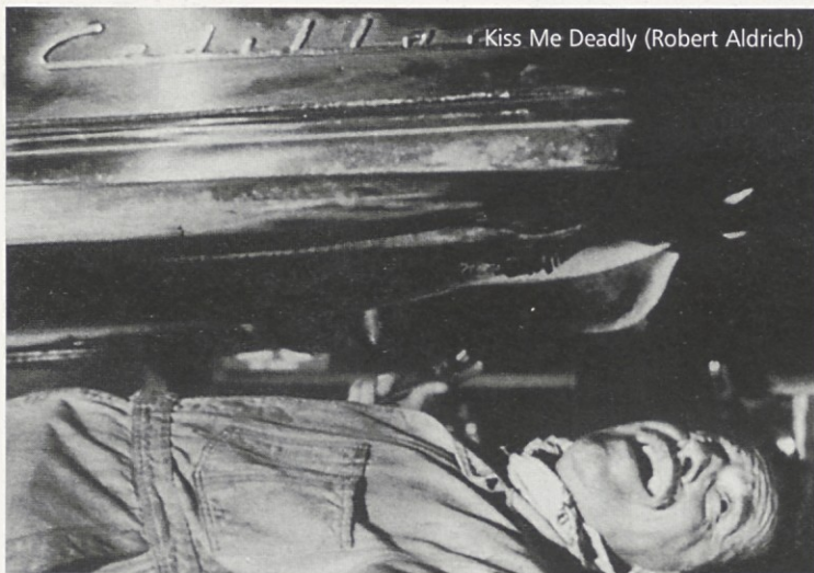
Kiss Me Deadly (Robert Aldrich)