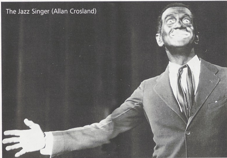
The Jazz Singer (Allan Crosland)