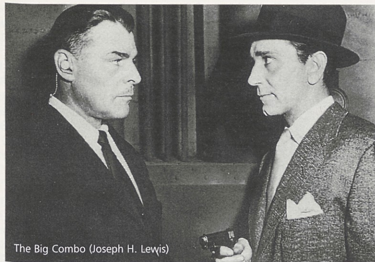
The Big Combo (Joseph H. Lewis)