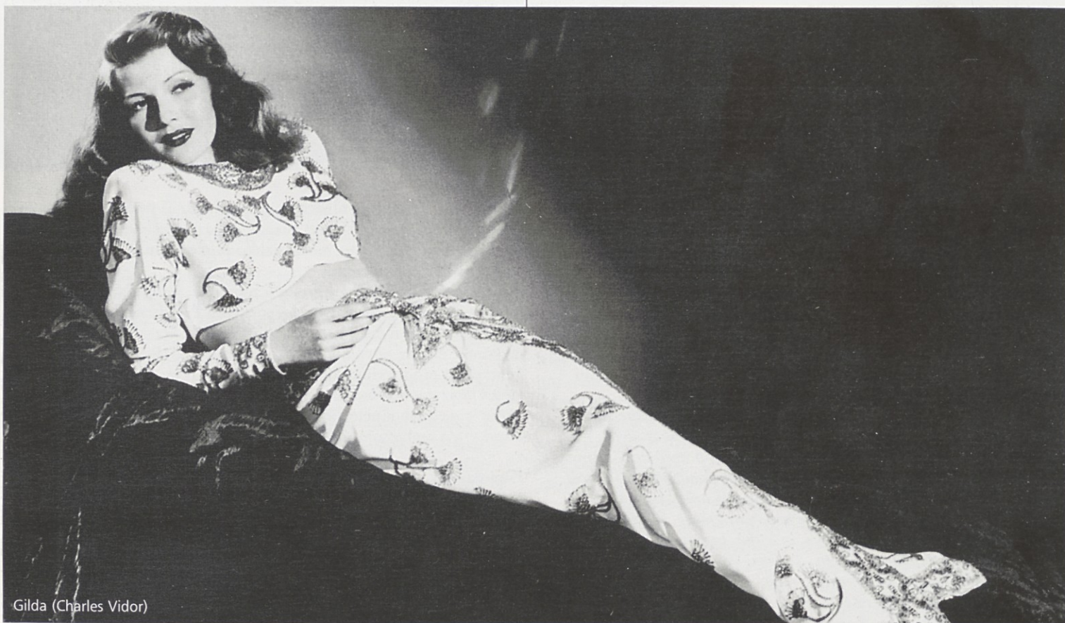
Gilda (Charles Vidor)

B filmi iz zlatega h'woodskega obdobja so idiom samega filma, zato je čas, da se B režiserje razčleni in razloči. Tale drugi del pregleda torej pojasnjuje, kdo je kdo, kdo je kaj posnel in komu je najbolj neslo. Da smo si takoj na jasnem: gre izključno za obdobje med prihodom zvočnega filma in začetkom šestdesetih, kar pomeni, da bodo B režiserji iz druge polovice šestdesetih in sedemdesetih – vključno z vsemi cormanovci – počakali na svojo rundo. Mnogi A režiserji so svoje kariere začeli z B filmi, toda potem so jih tudi hitro zapustili in prešaltali na bolj prestižno studijsko robo – William Wyler ( Her First Mate , 1933), George Stevens ( Cohens and the Kellys in Trouble , 1933), Jean Negulesco ( Singapore Woman , 1941), Douglas Sirk ( Hitler's Madman , 1943), Fred Zinnemann ( Eyes in the Night , 1942), Robert Wise ( The Body Snatcher , 1944), Mark Robson ( The Seventh Victim , 1943), James Whale ( Journey's End , 1930), Walter Lang ( Hell Bound , 1931), Garson Kanin ( A Man to Remember , 1939), John Sturges ( Mystery Street , 1950), pa tudi mlajši, recimo Arthur Hiller ( The Careless Years , 1957), Robert Altman ( The Delinquents , 1957) in Irvin Kershner ( Stakeout on Dope Street , 1958). Tale pregled jih zato ne upošteva, upošteva pa mnoge druge, ki so nihali med A in B ali pa so idiom B filma zanesli v svoje A projekte.