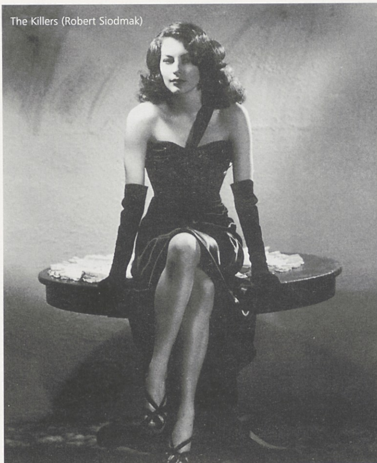
The Killers (Robert Siodmak)

Andre de Toth. Zelo ekonomičen z zelo sodobnim smislom za akcijo, toda vedno tudi dovolj angažiran. Dobro je razumel psihologijo, nasilje in neuspeh ameriškega sna. Prvi studijski 3-D film: House of Wax (1953). Odlična filma noir: The Pitfall (1948), Crime Wave