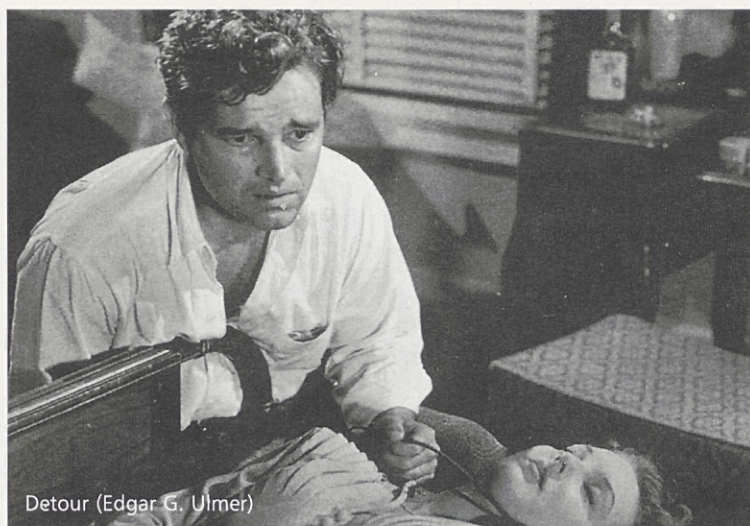
Detour (Edgar G. Ulmer)

Zombies (1946), kjer ni bilo zombijev, le nekaj dobre atmosfere, ki je obetala.