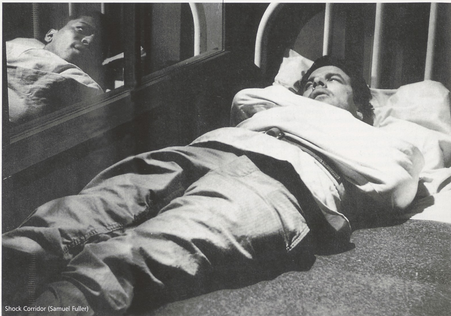
Shock Corridor (Samuel Fuller)

B filmi iz zlatega h'woodskega obdobja so idiom samega filma, zato je čas, da se B režiserje razčleni in razloči. Tale pregled bo torej pojasnil, kdo je kdo, kdo je kaj posnel in komu je najbolje neslo. Da smo si takoj na jasnem: gre izključno za obdobje med prihodom zvočnega filma in začetkom šestdesetih, kar pomeni, da bodo B režiserji iz druge polovice šestdesetih in sedemdesetih – vključno z vsemi cormanovci – počakali na svojo rundo. Mnogi A režiserji so svoje kariere začeli z B filmi, toda potem so jih tudi hitro zapustili in prešaltali na bolj prestižno studijsko robo – William Wyler ( Her First Mate , 1933), George Stevens ( Cohens and the Kellys in Trouble , 1933), Jean Negulesco ( Singapore Woman , 1941), Douglas Sirk ( Hitler's Madman , 1943), Fred Zinnemann ( Eyes in the Night , 1942), Robert Wise ( The Body Snatcher , 1944), Mark Robson ( The Seventh