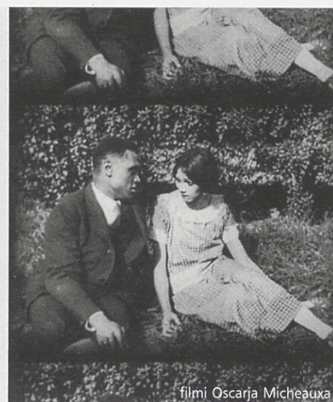
filmi Oscarja Micheauxa