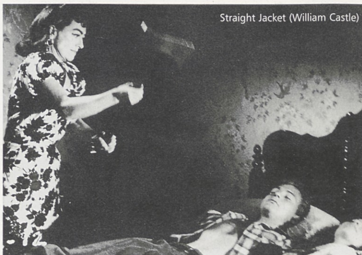
Straight Jacket (William Castle)

specialnih efektov, ki so bili vedno njegova kreacija, toda kljub temu je užival v svojem naivnem spektaklu: King Dinosaur (1955), Beginning of the End (1957), The Amazing Colossal Man (1957), Attack of the Puppet People (1958), War of the Colossal Beast (1958), The Spider (1958), The Magic Sword (1962), The Food of the Gods (1976), Empire of the Ants (1977).