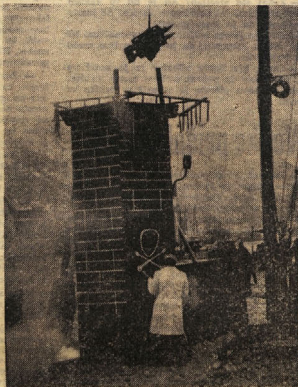
Atomskemu orožju so štete zadnje minute. Še malo in rakete bodo zgrmele v atomsko peč, seveda samo na litijskem karnevalu. Sicer pa...