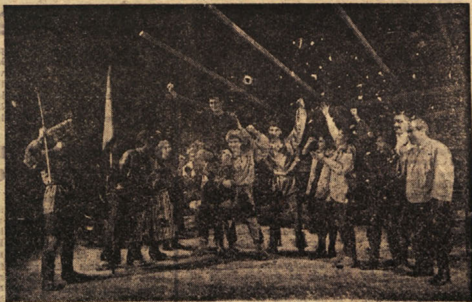
Iz igre »Pričenjamo Hvetik«, ki so jo uprizorili trboveljski gimnazijci

Predstava bo v soboto, 2. marca t. l. v gledališki dvorani Delavskega doma ob 19.30 uri za abonma. Vstopnice so tudi v prodaji. Avtor drame, kakor tudi žirija okrajnega Sveta Svobod bodo prisostvovali predstavi v Trbovljah.