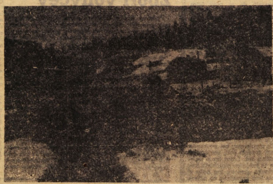
Huda zima in mraz nista prizanesla niti trboveljski cvetličarni in rastlinjaku. Medtem ko so lani v dobrih treh in pol mesecih porabili za ogrevanje rastlinjaka le 5 ton premoga, so ga letos pokurili nekaj nad 14 ton. Mimo tega je bil tudi promet veliko slabši kot lani.

LITIJA — Na zadnji seji obeh zborov občinskega LO Litija so na začetku seje pri točki »Interpelacije odbor-nikov« postavili odbor-niki več vprašanj, tako glede dela poravnalnih svetov, vzdrževanja cest, alabe opravljenega dela v zvezi s tuberkulizacijo goveje živine, potrebe po izdaji dodatnih dovoljenj za sečnjo lesa (zaradi zime) in plačila honorarja za kuharice v šolskih mlečnih kuhinjah. Odborniki bodo dobili odgovore na postavljena vprašanja na prihodnji seji.