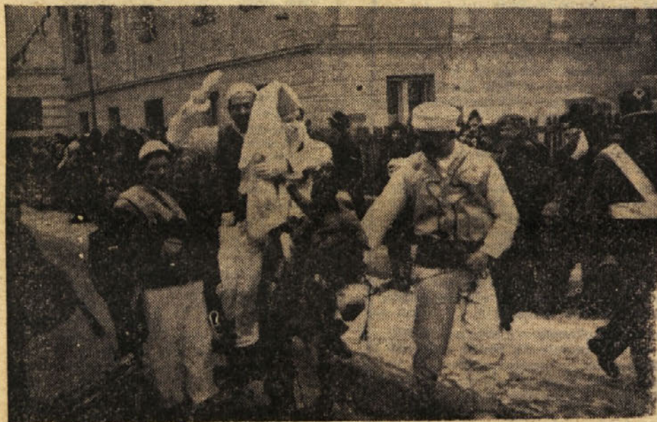
Skoro največjo pozornost je na 399. svetovni razorožitveni konferenci v Litiji vzbujal delegat Albanije. Ta je v Litiji zasnil brhko dekle in z njo odšel na razorožitveno konferenco.

399. svetovna razorožitvena konferenca je bila tako končana. Številni obiskovalci karnevalske Litije pa so ostali v mestu ob Savi še dolgo v noč in se zabavali.