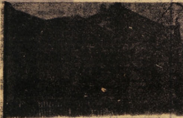
Novo šolsko poslopje v Radečah bi bilo treba še letos dograditi

reba, da se z gradnjo šole konča v letošnjem letu, saj postaja pouk na naši šoli iz dneva v dan nemogoč. Dela smo že v treh izmenah, te žave pa so še z dopolnilnimi urami. Tudi pogoji za ostalo dejavnost na šoli so neprijemni. Zdaj ob polletju nisno mogli biti zadovoljni z učnimi uspehi, čeprav lahko odkrito rečem, da se je kolektiv trudil, da bi bilo boljše. Tudi uveljavljanje šolske reforme pri nas le postopoma napreduje.