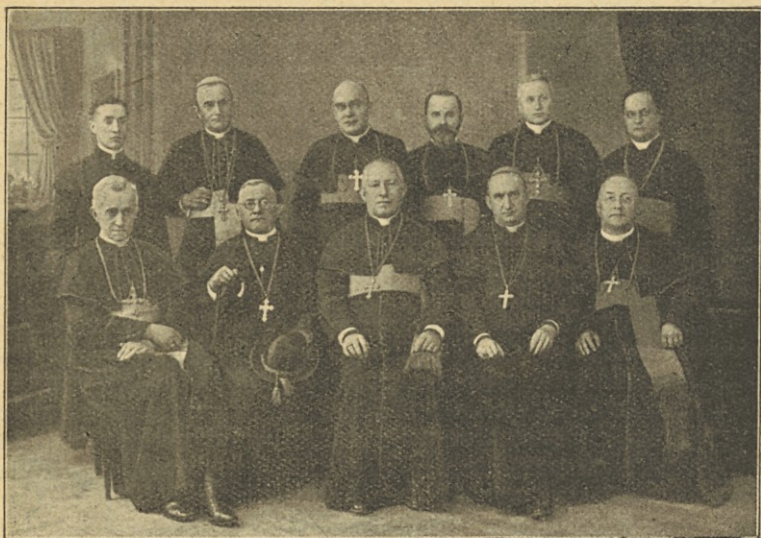
Škofje na vzhodnem kongresu v Ljubljani.

enkrat) snidejo, ne le, da čim globlje in obširno razpravljajo o vsem, kar zadeva vesoljno cerkveno edinost, ampak da se tudi čim uspešneje razširi pravo znanstveno poznavanje in posvetovanje. Zato se veselimo, da se bodo tega prvega zborovanja o vzhodnem bogoslovju udeležili profesorji Našega rimskega Vzhodnega zavoda z drugimi izkušenimi možmi, da bodo zborovalcem podali najvažnejša poglavja vzhodnega bogoslovja in da bodo vzbudili nove obdelovalce te vede, ker smo pre-