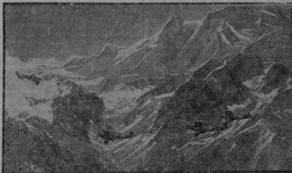
Najvišje točke Himalaja pogorja v severni Indiji so preletela angleška bomba na letala.

pomagal, da se še letos poročim.« A je prišel žalostni dan, ko je morala zapustiti svojo službo ter se preseliti v porodnišnico. Ženin jo je pridno obiskoval in obetal zlate gradove, čeprav je moral vedeti, da jih izpolniti ne more. Brez poročnega prstana je šlo zapeljano dekletu z detetom k laži-ženinu stanovat in stradati. Saj še toliko ni zaslužil, da bi ob mesecu plačal stanovanje. Zato jo je kratkomalo v temni noči popihal čez mejo: Nesrečnica pa je v črni noči hitela vsa sestradana in premražena na njegov dom, kjer so jo — kratkomalo odslovili ter še ošteli. Bližu je bila obupu, a še ena pot ji je bila odprta: k lastni materi. Zopet je hitela v temni noči v hribe ter potrkala na okence, kjer so spali njena bedna mati. Oj, koliko solz je teklo tisto noč pri ubogi materi, ki je bila sama potrebna podpore. — Dete je ostalo pri stari materi, a revica je šla iskat nove službe, kjer se hoče truditi, da pomaga svoji materi in svojemu otročičku, da oba ne sestradata v gorski samoti. Kje pa j