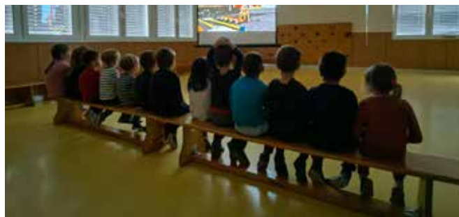
Otroci z zanimanjem gledajo risanko Gasilec Samo (foto: Žan Javornik).

V dogovoru z vodstvom šole smo pričeli z izvedbo krožka. K sodelovanju smo povabili tudi PGD Svetina in PGD Prožinska vas, slednji nam občasno tudi pomagajo pri njegovi izvedbi. Med otroke smo razdelili letake »Mladi gasilec – pionir« in »Cicigasilec«. Večje zanimanje za gasilstvo so pokazali predšolski otroci.