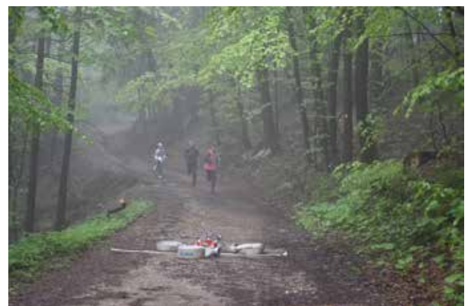
Tekmovanje v gasilski orientaciji

Sledil je največji organizacijski dogodek v zadnjih letih v PGD Svetina, to je tekmovanje GZ Celje v gasilski orientaciji, ki je potekalo v soboto, 13. maja. Žal nam je zagodlo vreme, vendar so se mladi gasilci pogumno podali na pot in v svetinskih gozdovih neizmerno uživali. Iz PGD Svetina je nastopila ekipa