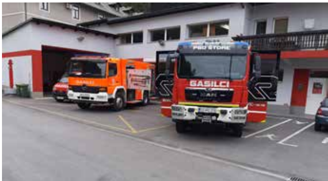
Dan odprtih vrat v gasilskem domu PGD Štore.

zali navdušenje nad videnimi aktivnostmi. Seveda pa tega dogodka ne bi zmogli tako dobro organizirati tudi brez pomoči naših operativnih gasilcev. Po končani predstavitvi pred šolo in vrtcem se je dogajanje preselilo v gasilski dom PGD Štore. Tam so si lahko obiskovalci ogledali opremo, s katero društvo razpolaga, in našo zgodovinsko sobo, kjer so si lahko ogledali tudi slike, priznanja, pokale in obleke iz bogate zgodovine našega društva. Še enkrat hvala vsem udeležencem, da ste nas prišli pogledat in nam s tem pokazali, da cenite naš trud in naše poslanstvo.