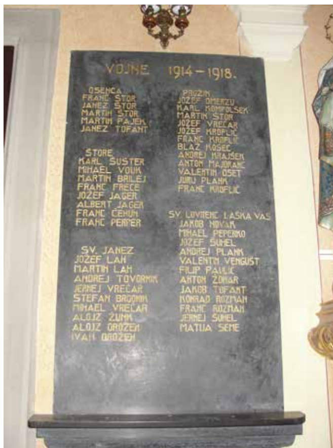
Spominska plošča padlim vojakom 1. vojne v cerkvi sv. Martina na Teharjah