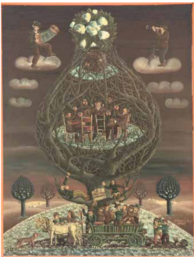
Pust v Kompolah iz cikla: Praznični trenutki kmečkega življenja (olje, platno, 70x50 cm)