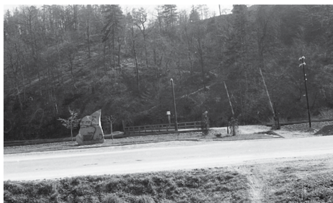
Spomenik v spomin na XIV. divizijo pri Voglajni na Opoki leta 2023

Organizacija Zveze borcev v Štorah je postavila in odkrila spominsko ploščo padlim ljudem na območju krajev občine Štore, vzdano na nižjo gimnazijo v Štorah (kasneje je bila spominska plošča prenesena k novozgrajeni osnovni šoli na Lipo) leta 1955. Prav tako so postavili spomenik pri mostu čez Voglajno na Opoki na spomin prehoda XIV. divizije