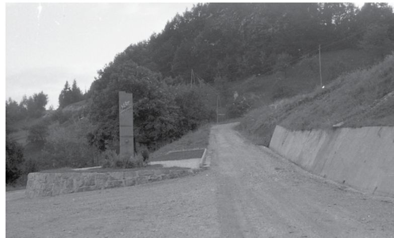
Spomenik padlim borcem Kozjanskega odreda na Svetini leta 1955 (fototeka Železarski muzej Štore; zbral in uredil Marjan Mačkošek)