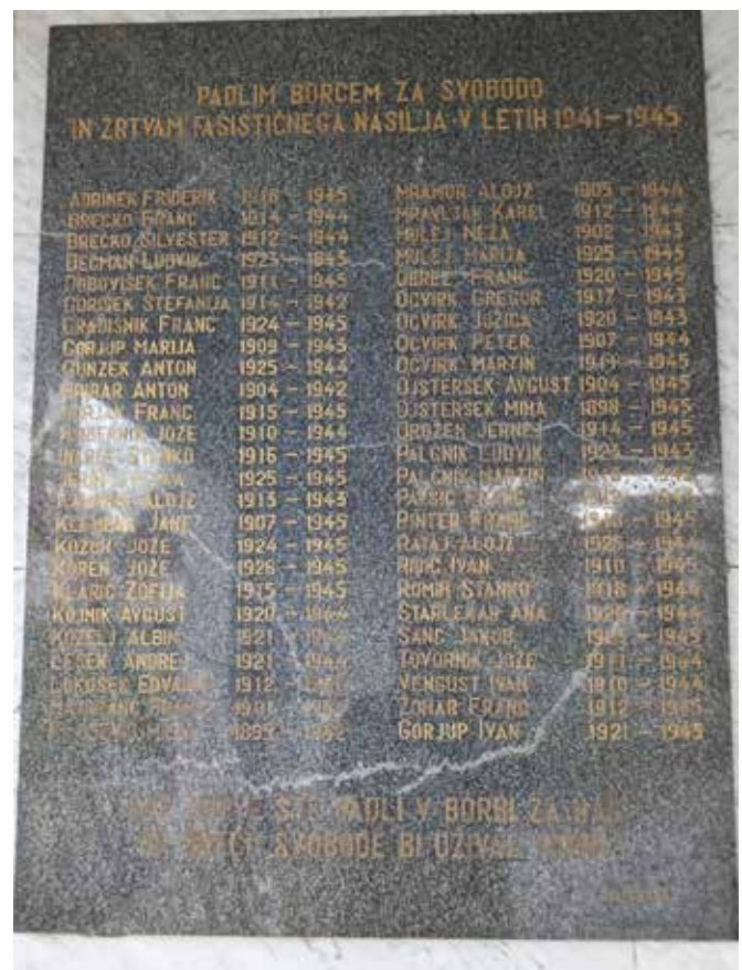
Spominska plošča padlim med 2. svetovno vojno na OŠ Štore