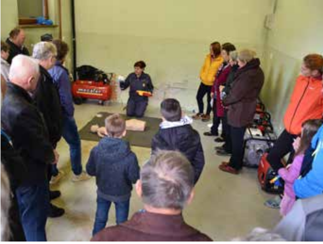
Dan odprtih vrat