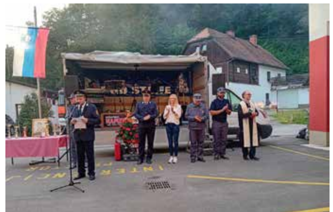
Svečani prevzem motorne brizgalne Rosenbauer (foto: Bojana Papler).

pomoč pri nakupu nove motorne brizgalne se zahvaljujemo Občini Štore in številnim podjetjem in podjetnikom. Še enkrat iskrena hvala za vso podporo in donacije. Sledila je podelitev napredovanj in činov našim gasilcem, ki so se udeležili izobraževanja v pomladanskih mesecih. Na koncu pa smo podelili priznanja in pokale starejšim gasilkam in gasilcem. Po končanem uradnem delu je za dobro voljo je poskrbel ansambel Namen.