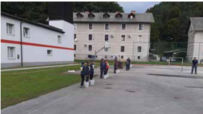
Tekmovanje pionirjev PGD Štore za pokal Štefana Krumpaka v Štorah.

30. septembra smo organizirali 26. meddruštveno tekmovanje za pokal Štefana Krumpaka. V dopoldanskem času je tekmovalo 6 ekip pionirjev, v popoldanskem času pa ekipe starejših gasilcev in dve ekipi starejših gasilk. Na obeh tekmovanjih je imelo tudi naše društvo več železij v ognju. Po dolgem času smo nastopili z dvema desetinama pri pionirjih, eno ekipo starejših gasilcev in eno ekipo starejših gasilk. Za vse ekipe lahko rečemo, da so bile konkurenčne ostalim ekipam, največ uspeha pa so pozele starejše gasilke z osvojenim drugim mestom. Ponosni smo na naši pionirski ekipi, saj smo bili v zaostanku pod 10 točk za zmagovalno ekipo PGD Sveti Štefan, druga ekipa pionirjev pa je zaradi odsotnosti dveh pionirjev nastopala izven konkurence in nas tudi ni razočarala. V obeh ekipah so bili tudi pionirji, ki so se nam pridružili pred kratkim in so prvič tekmovali.