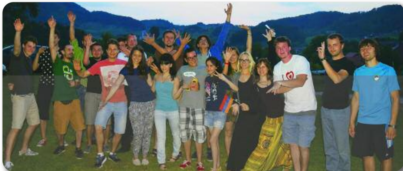
Skupinska fotografija s člani Turističnega društva Žetale