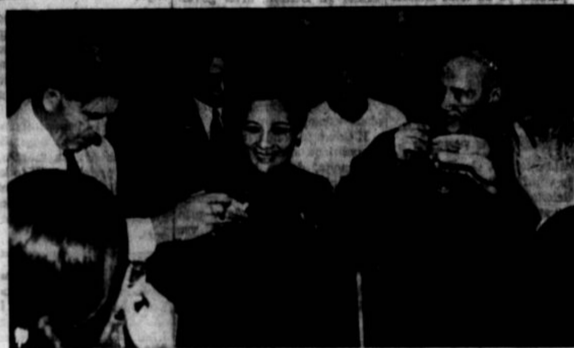
Podpredsednik Združenih držav Henry Wallace v družbi Čang Kaiška in njegove žene na Kitajskem. Visoka družba na sliki pije zdravico nazmago zaveznikov. Namen Wallacove misije je bil utrditev prijateljstva med obema državama.