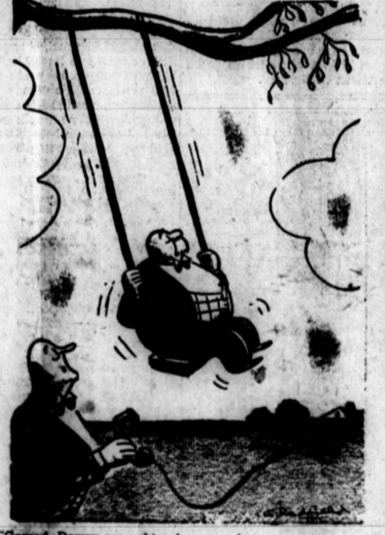
"Gospod Dewey nas vabi z drevesa v boj za povrnitev v slabo, stare čase..."