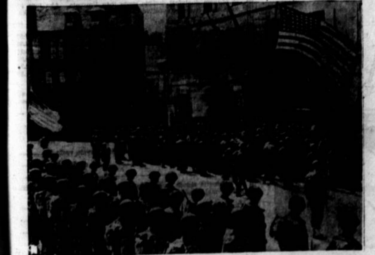
Slika kaže, ko ameriški vojski po zmagi nad nacisti izročajo mesto Cherbourg francoski civilni oblasti.

V Prosveti so dnevne svetovne in delavske vesti. Ali jih citate vsak dan?