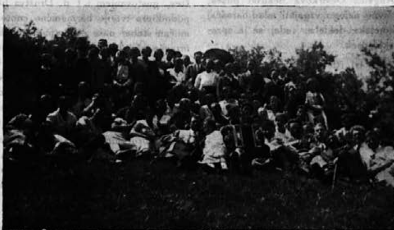
Udeleženci izleta, ki ga je priredil dne 13. maja 1934 naš Krški pododbor na Stojdrago