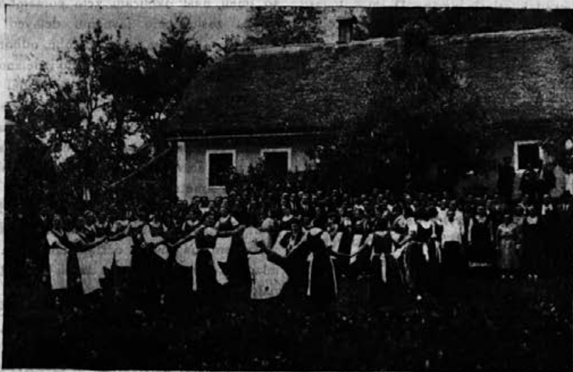
Udeleženci izleta na Rifnik dne 6. maja 1934, ki so ga priredila naša društva v Sv. Juriju ob j. ž., Slivnica, Dramlje in Ponikva ob j. ž.