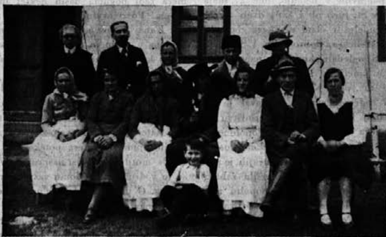
Naše društvo v Rožnem dolu: Igralci igre „Užitkarji“.