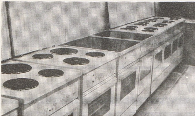
Gorenje ponuja štedilnike širine 500 in 600 mm, opremljene z različnimi kuhališči.