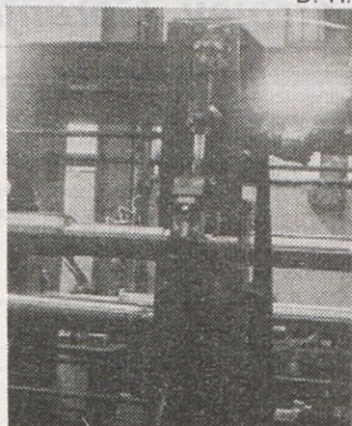
Transportna zlagalna naprava za jeklene profile