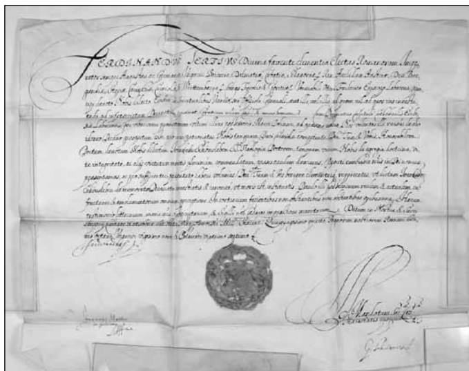
Slika 3: Cesar Ferdinand III. prezentira Schönlebna za dekana ljubljanskega stolnega kapitlja, Regensburg, 6. maj 1654 (NSAL, NŠAL 101, 1654 V 6., Regensburg).