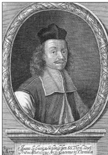
Slika 1: Schönlebnova upodobitev (J. L. Schönleben: Horæ subsecivæ dominicales , 1. del, Salzburg, 1676).

Janez Ludvik Schönleben (1618–1681), zgodovinar, polihistor, pridigar in teolog, je kljub svoji veličini – bil je namreč tesno vpet v širši evropski kontekst, za sabo je zapustil obsežen in vsebinsko širok opus – slabo in malo poznana osebnost. Razen Radicseve obravnave Schönlebnovega življenja in dela iz leta 1894 ( Der krainische Historiograph Johann Ludwig Schönleben ) in Miklavčičevega prispevka za Slovenski biografski leksikon iz leta 1967 o Schönlebnu še ni bila napisana nobena biografska študija, ki bi temeljila strogo na arhivskih virih. Do sedaj je bil širšega evropskega priznanja, pa še to s precejšnjim časovnim zamikom, deležen le kot teolog – mariolog, kot zgodovinar, polihistor in pridigar pa je po krivici ostal v senci drugih osebnosti svojega časa, zlasti Valvasorja in Svetokriškega. Prispevek bo na podlagi analize primarnih virov poskušal dopolniti dosedanje vedenje o Schönlebnovem življenju, hkrati pa bo na kratko predstavil tudi njegov opus.