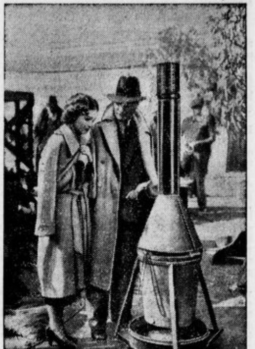
V solnčni Kaliforniji je tudi mrzlo. Celotni filmski zvezdniki, ki delajo zunaj na prostem, si med odmorom morajo ogriniti svoje suknje ter se hite gret k peči, ki je postavljena zunaj na prostem za nje.