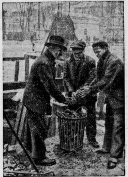
Mráz stiska ljudi. V Berlinu so na cestah postavljene peči s koksom, kamor se hodijo gret delavci, ki morajo delati zunaj.