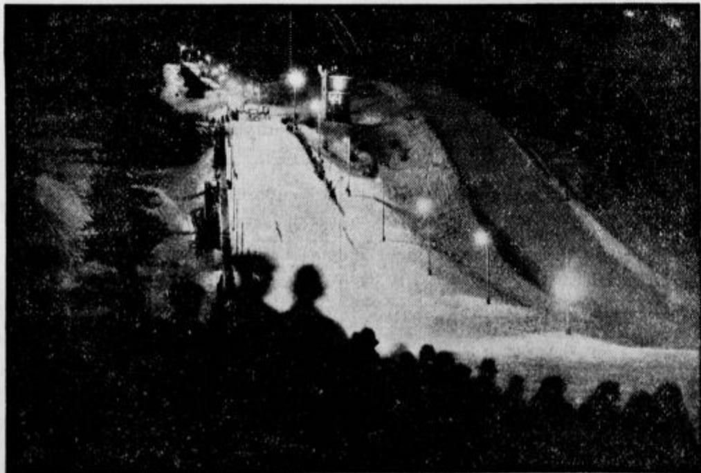
Ponočni skoki v Garmisch-Partenkirchen-u, kjer je avstrijski športnik, mladi Bradl dosegel največjo daljavo 54 m. Bradl je na Planici skočil 101 m.

»Koliko bratov imaš?« — »Dva.« — »Kako je to mogoče, tvoj oče je vendar rekel, da ima tri sinove?«