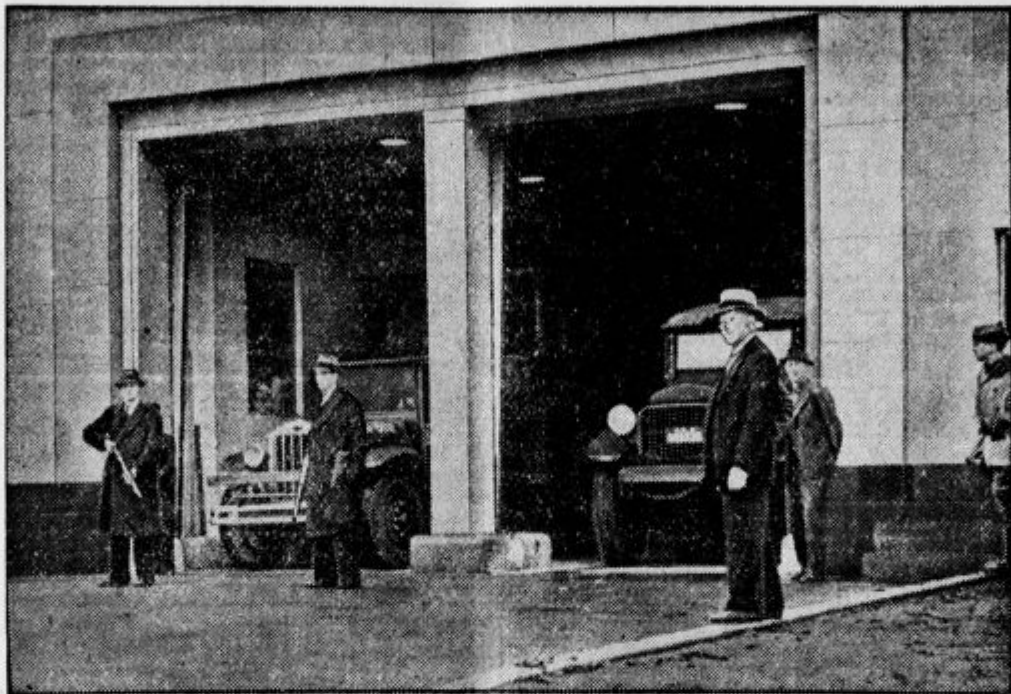
Amerikanski Fort Knox, kamor vozijo sedaj milijarde zlata hranit.