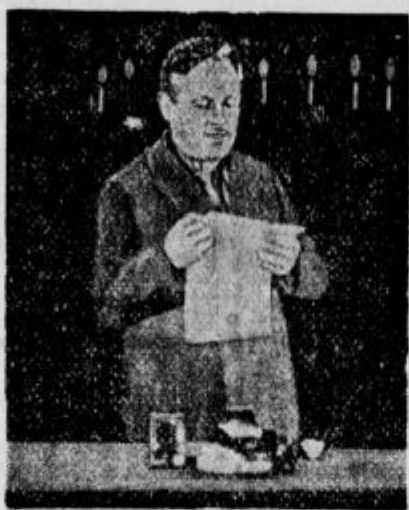
Državni tožilec, poljski žid Višinski.

Za zadnji seji glavnega sovjetskega tribunala, na kateri je državni tožilec Višinski predlagal smrtno kazen za vseh sedemdeset obtožencev, katerim njihova karamazovska priznanja niso ničesar pomagala, smo slišali zadnje izpovedi ljudi, starih revolucionarnih borev, ki so zadnje dni svojega življenja omadeževali s skrajnim samoponizanjem.