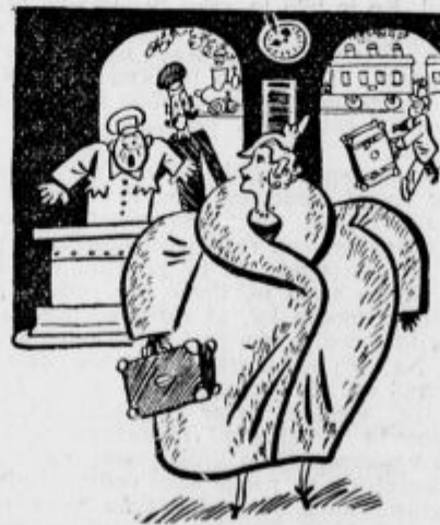
Na carinski meji.

Iz okolice članov znanstvene ekspedicije pa pripovedujejo, da posamezni člani ekspedicije trde zaupno, da je vzrok bolezni prešlaba prehrana tamkajšnjega prebivalstva.