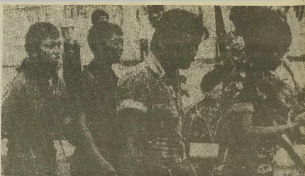
Poskus državnega udara na Tajskem se je izjalovil. Končano je tridnevno brezvladje. Že prvega dne je bilo jasno, da uporniki ne bodo s svojo namero uspeli. Čete, ki so ostale zveste tajskemu predsedniku, so glavno mesto države Bangkok zasedle brez preliivanja krvi. Na posnetku agencije UPI: prevratniška vojska v rokah vladnih čet.

Bo Reagan spremenil svoje mnenje o „oboroženi svobodi“?