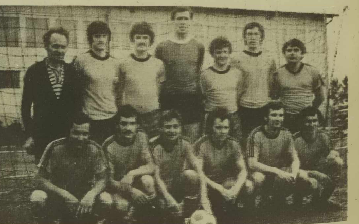
Nogometno moštvo Piramida, ki tekmuje v drugi občinski nogometni ligi Lendava.