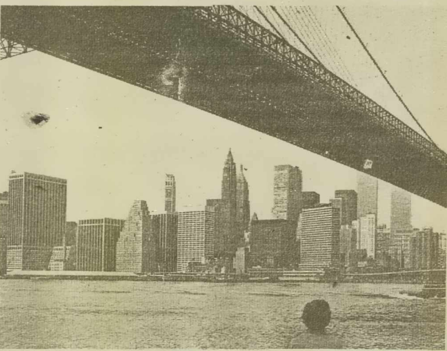
V teh nebotičnikih so le uradi, kjer je zaposlenih na tisoče. uslužbencev.

Z Dušanom sva se odločila, da si bova okolico hotela ogledala že pred zajtrkom. Zunaj je tako strašno zavijal veter, da sva se vrnila po toplejša oblačila. Ni mi bilo žal, ker sem v domovini poslušal nasvet, da naj se toplo oble-