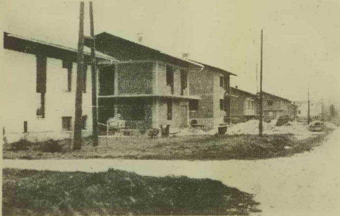
Novo stanovanjsko naselje v Lipovcih

Zelo razgibana dejavnost v Lipovcih me je pritegnila, da sem obiskal to strnjeno naselje, ki šteje okrog 1.020 prebivalcev. Kraj je predvsem znan po izdelovalcih dožnjakov, ki so zelo iskani ne samo pri nas, temveč tudi v tujini. V zadnjih letih se kraj naglo razvija in tudi spreminja strukturo prebivalstva. Lahko bi rekli, da gre za delavsko-kmečko naselje, saj so v kraju le štiri zares čiste kmetije, medtem ko je pri ostalih gospodinjstvih vsaj po en zaposlen. Največ jih združuje delo v soboških delovnih organizacijah Mura, Pomurje, Panonija, Tovarna mesnih izdelkov, nekaj pa tudi v Beltinski Beltinci. Z izgradnjo industrijskih objektov — Lek je že zgrajen, začela se je gradnja gradbenih elementov Konstruktorja-Pomurje, predvidena pa je letos še gradnja skladišča za krompir KZ Panonka — se bo struktura prebivalstva tudi v prihodnje spreminjala v korist delavcev. Sicer pa v Lipovcih nastaja novo naselje takoj za pokopališčem, kjer je že zgrajenih 13 stanovanjskih hiš, tri pa bodo kmalu začeli graditi. Poleg tega pa je pripravljenih 21 novih parcel za individualno stanovanjsko gradnjo.